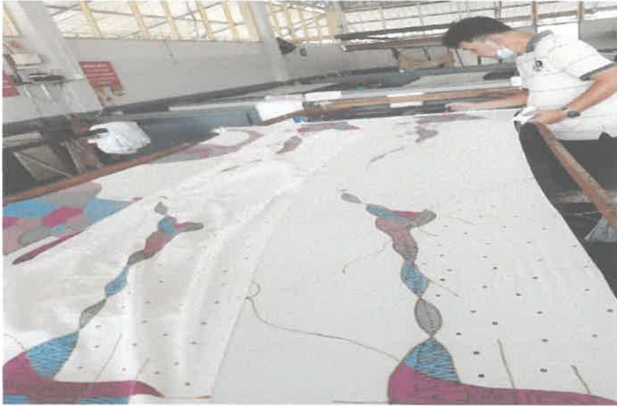
Gambar 6: Pekerja sedang mencanting, mewarna batik hasil tempahan pelanggan dibengkel.