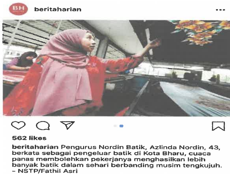
Gambar 3: Keratan akhbar ketika ditemuramah pihak media menunjukkan gambar yang diambil oleh NSTP