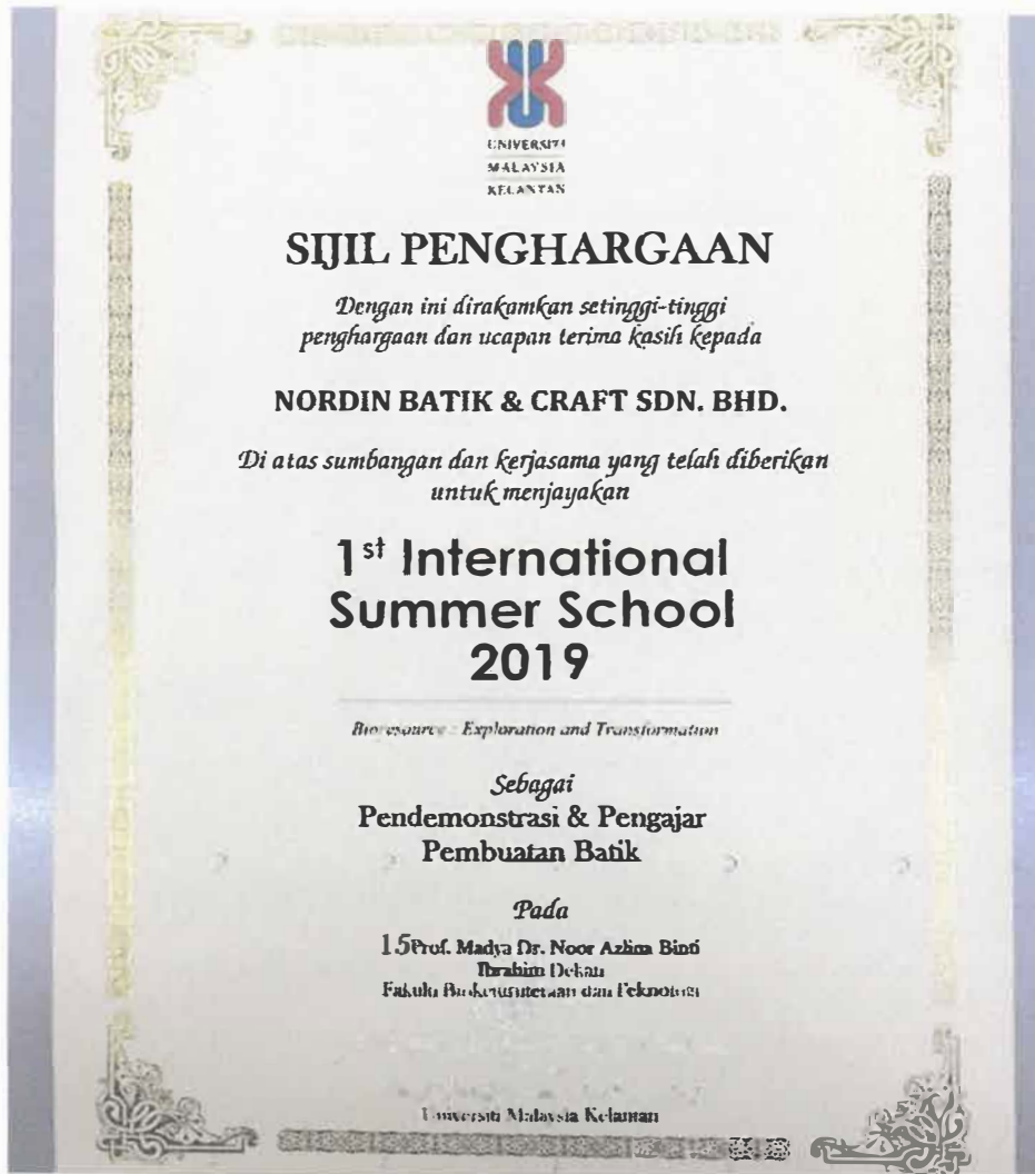
Gambar 12: Sijil Penghargaan Pendemonstrasi & Pengajar Pembuatan Batik