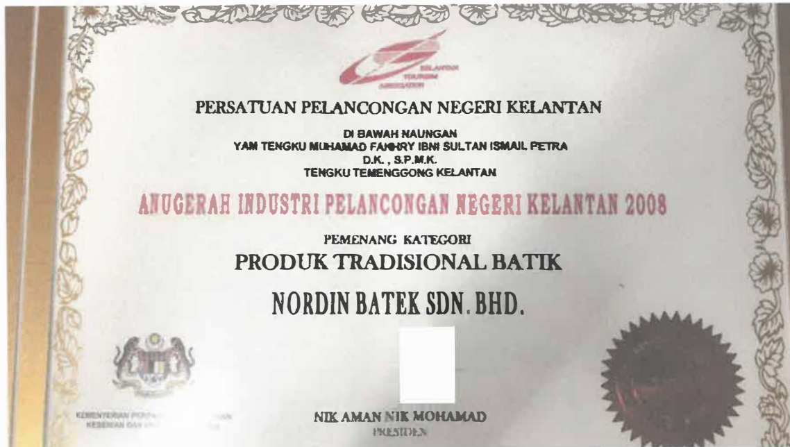
Gambar 9: Sijil Penghargaan Anugerah Industri Pelancongan Negeri Kelantan 2008