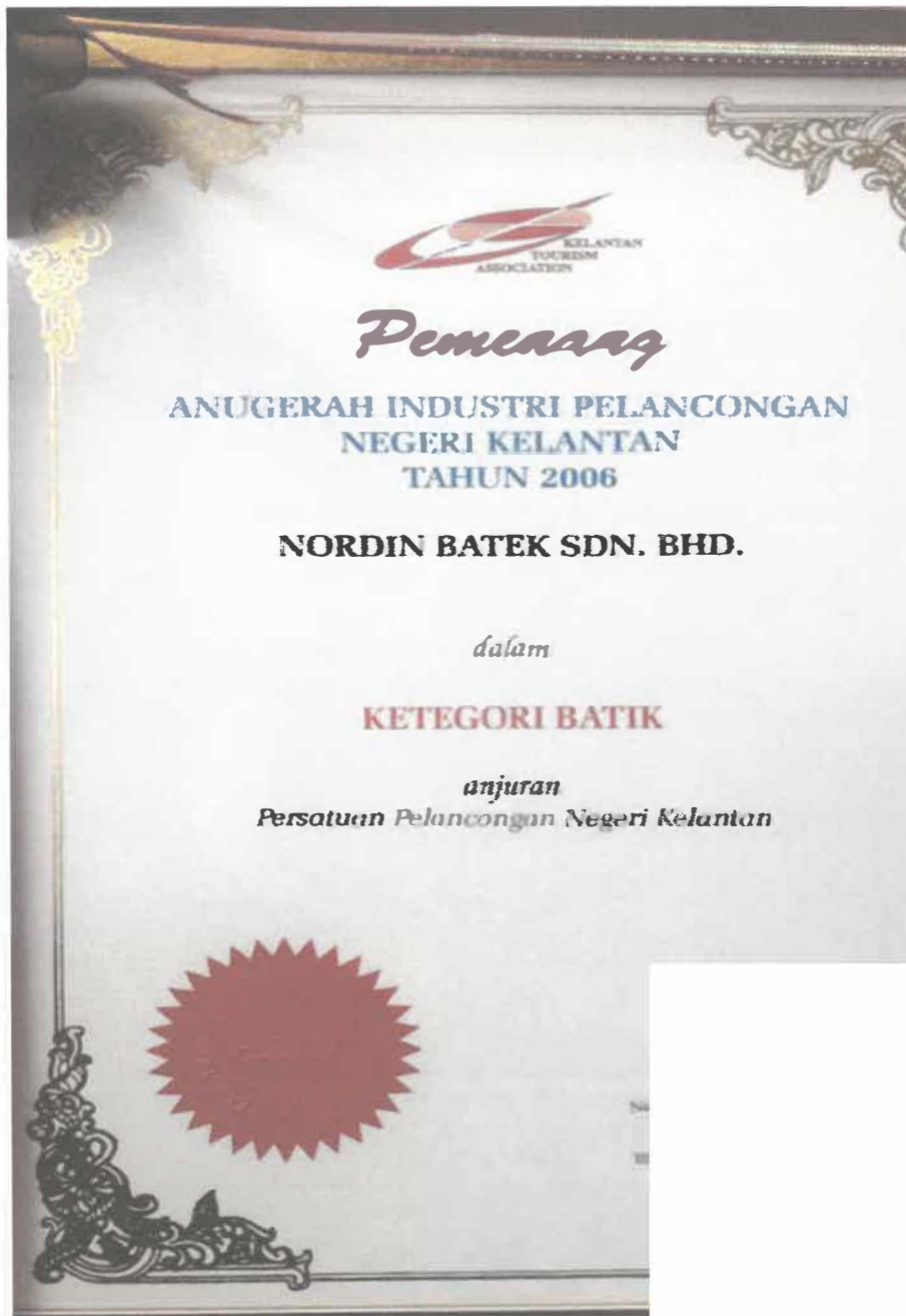
Gambar 10: Sijil Penghargaan Anugerah Industri Pelancongan Negeri Kelantan