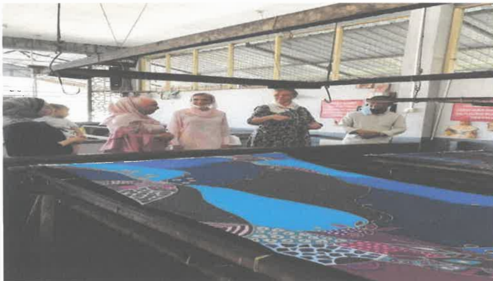
Gambar 5: Tengku Permaisuri Sofie Louise Johansson membuat tinjauan di bengkel pembuatan Batik secara dekat.