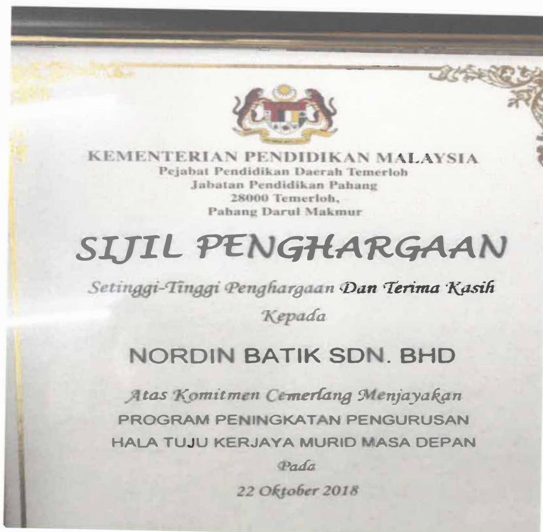
Gambar 11: Sijil Penghargaan Atas Komitmen Cemerlang Menjayakan Program Peningkatan Pengurusan Hala Tuju Kerjaya Murid Masa Depan