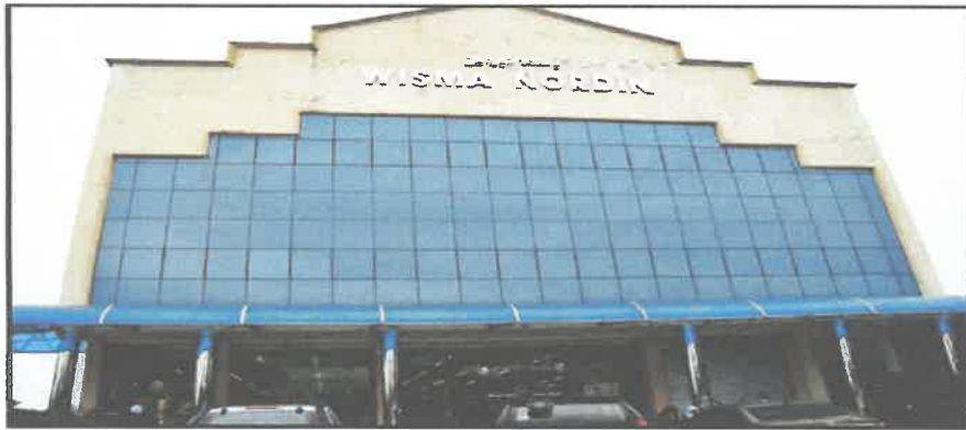
Gambar 7: Wisma Nordin