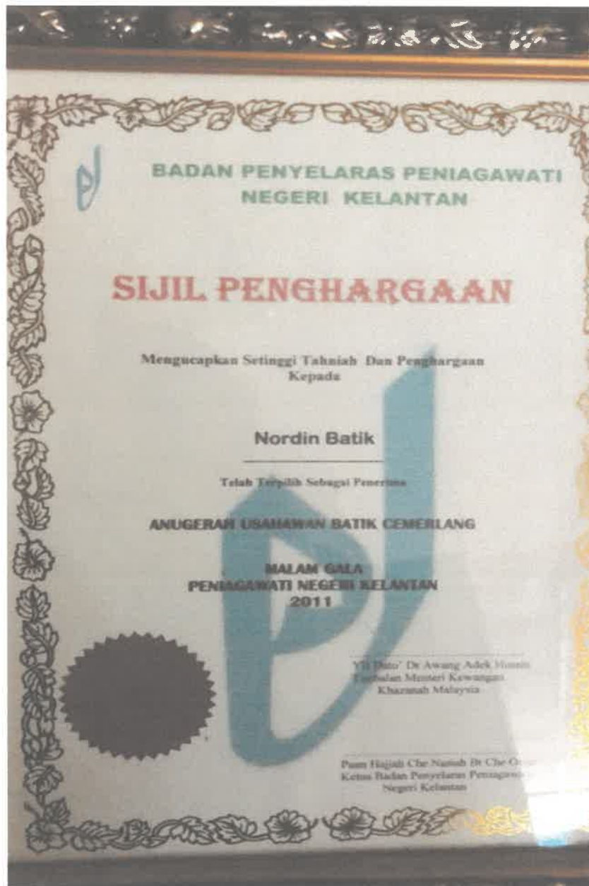
Gambar 8: Sijil Penghargaan Anugerah Usahawan Batik Cermerlang