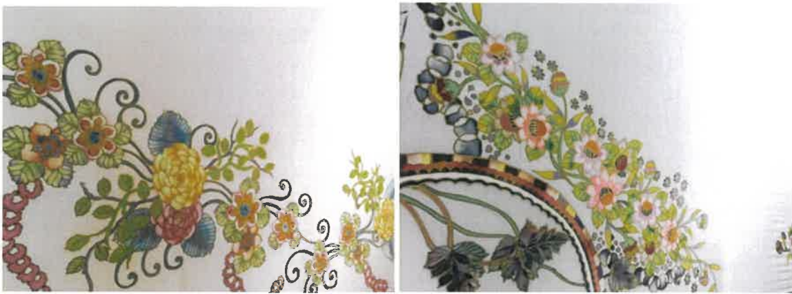
Figure 1: Hasil batik lukis yang dihasilkan oleh beliau