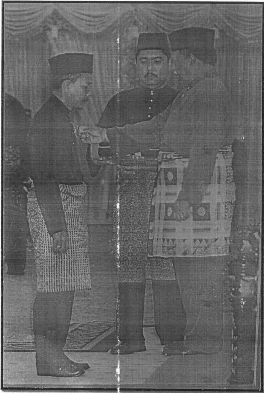
Gambar 1: Darjah Ahli Mangku Negara (A.M.N.)