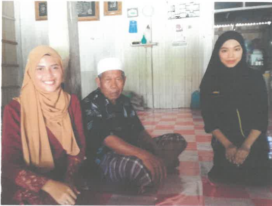
Gambar 1 Bersama pencerita