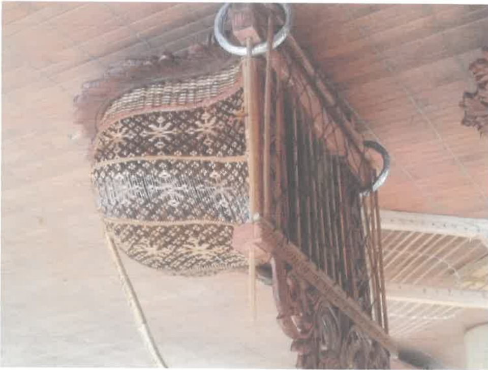
Gambar 3 Krat tangan jebak puyuh