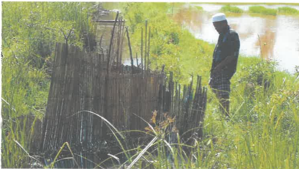
Gambar 2 Perangkap Bunohan