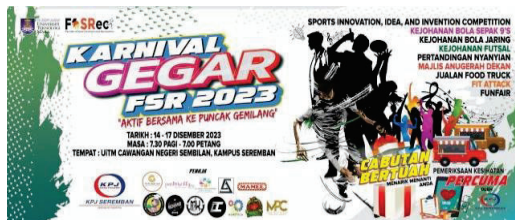
Gambar 2: Logo penaja di poster karnival dan latar belakang pentas

membolehkan perjalanan program berlangsung dengan jayanya. Karnival Gagar FSR telah dimeriahkan dengan barisan penaja-penaja ternama seperti KPJ dan Raqtive untuk memperkenalkan produk dan perkhidmatan mereka kepada komuniti UiTM. Dalam masa yang sama penglibatan para penaja telah memberikan peluang kepada mereka untuk memperluaskan jenama dan membantu meningkatkan jualan.