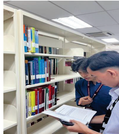
Gambar rajah 3: Pelajar sedang meneliti maklumat dari sumber bercetak

Proses dimulakan dengan mencari jawapan dengan merujuk maklumat bercetak terlebih dahulu. Pencarian bahan adalah dengan menggunakan sistem katalog perpustakaan atau Online Public Access Catalog (OPAC) . Setelah mendapatkan nombor panggilan sesuatu bahan, pelajar akan pergi mendapatkan bahan-bahan tersebut di rak. Proses pencarian maklumat dilihat memberi kesan yang amat baik bagi para pelajar apabila jawapan mudah diperolehi dan seterusnya menjawab kesemua soalan-soalan fakta atau fact findings . Bagi soalan yang memerlukan rujukan bahan atas talian, pencarian maklumat perlu berasaskan dari sumber.edu, .gov atau .org.