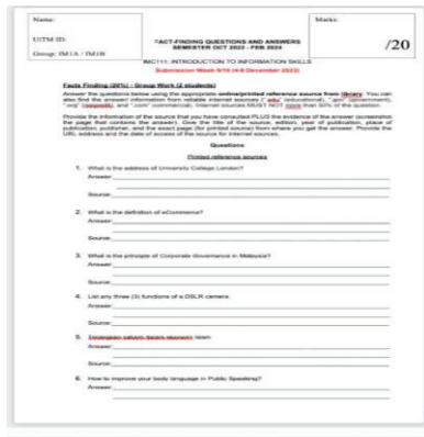
Gambar 1: Contoh soalan-soalan fakta atau fact findings

Proses dimulakan dengan mencari jawapan dengan merujuk maklumat bercetak terlebih dahulu. Pencarian bahan adalah dengan menggunakan sistem katalog perpustakaan atau Online Public Access Catalog (OPAC) . Setelah mendapatkan nombor panggilan sesuatu bahan, pelajar akan pergi mendapatkan bahan-bahan tersebut di rak. Proses pencarian maklumat dilihat memberi kesan yang amat baik bagi para pelajar apabila jawapan mudah diperolehi dan seterusnya menjawab kesemua soalan-soalan fakta atau fact findings . Bagi soalan yang memerlukan rujukan bahan atas talian, pencarian maklumat perlu berasaskan dari sumber.edu, .gov atau .org.