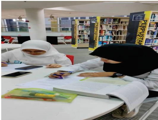
Gambar 5: Pelajar menapis maklumat yang diperolehi

Seterusnya pelajar didedahkan mengenai tatacara menggunakan sumber dan menyebarkan maklumat. Antara panduan yang diberikan adalah seperti tidak memanipulasi sesuatu isu untuk kepentingan sendiri, tidak mencetak atau memplagiat bahan, tidak mencero boh atau mengeksploitasi maklumat peribadi orang lain, menyatakan sumber rujukan, memastikan kesahihan seseuatu maklumat, mendapatkan pengesahan daripada pihak berkuasa, tidak menokok tambah maklumat atau isi kandungan, menyebarkan berita atau maklumat yang sahih dan tidak menyentuh isu perkauman, tidak membuat serangan peribadi ke atas pihak lain dan akhir sekali tidak memuat naik isu negatif, pornografi atau yang tidak sopan di media sosial.