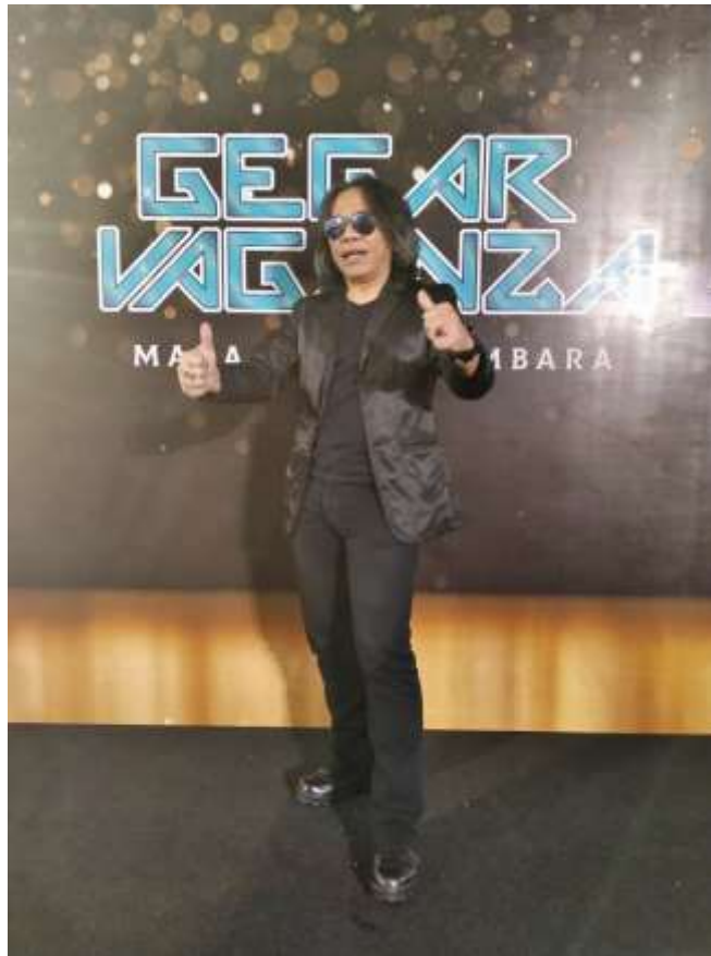
Rajah 5: Mus May di dalam Gegar Vaganza musim ke 7