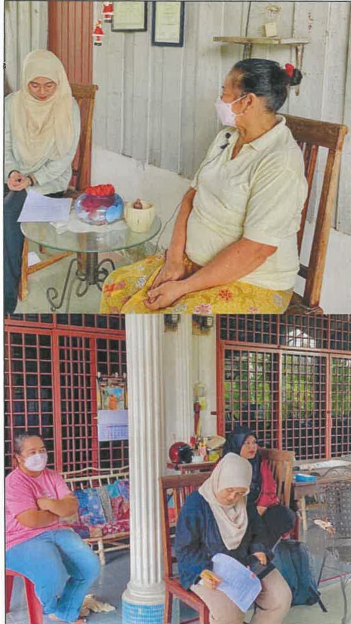
Gambar 4: Disebalik tabir temu bual bersama puan Mek Eek