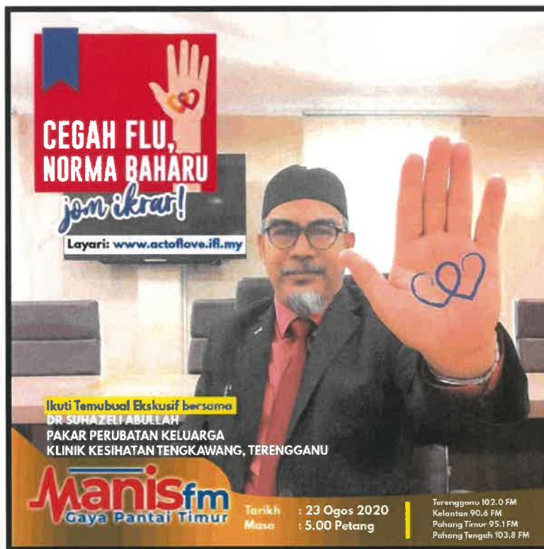
RAJAH 4: Temu bual bersama Manis fm.