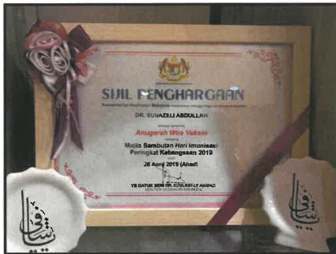
RAJAH 5: Sijil Anugerah Wira Vaksin