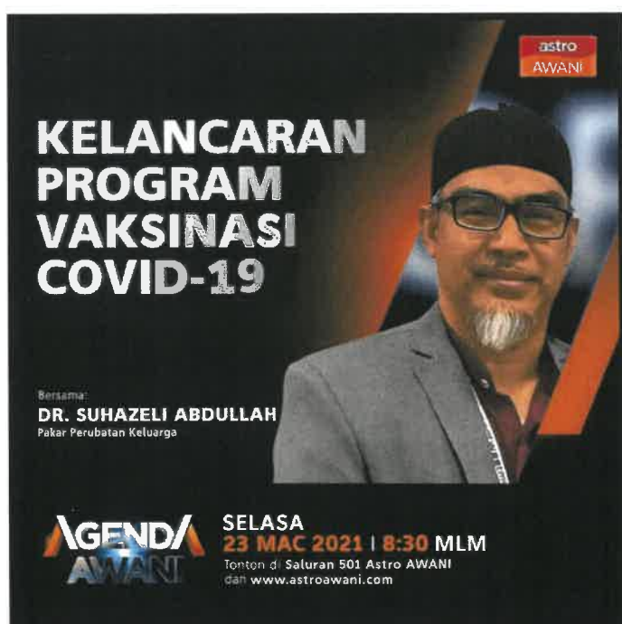
RAJAH 2: Poster Program Vaksinasi Covid-19