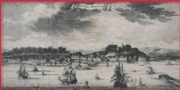
Francois Valentyn De Stad Malacca

Gurisan / 30 x 56 cm / 1724-1726 / Richard Curtis, Kuala Lumpur