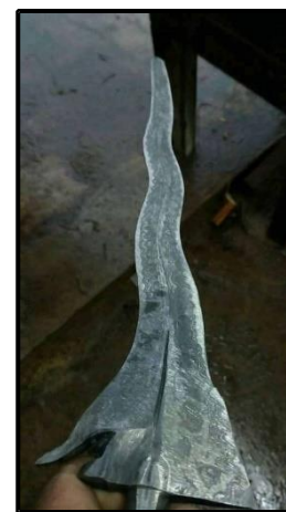
Gambar 13: Hasil terakhir bilah keris