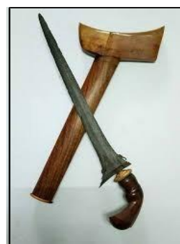
Gambar 9: Keris Saras