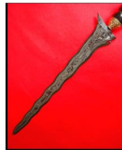
Gambar 5: Keris Sumatera