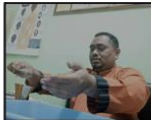
Gambar 15: Menghayun bilah keris pada kepulan asap kemenyan