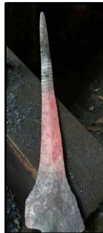
Gambar 12: Bentuk asas keris