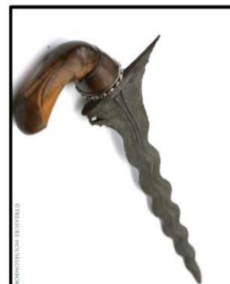
Gambar 7: Keris Bugis