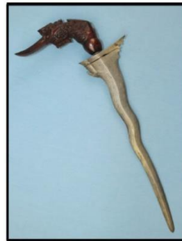
Gambar 3: Keris Pekaka