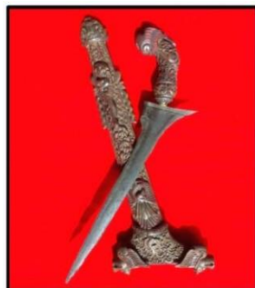
Gambar 6: Keris Bali