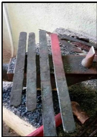
Gambar 11: Bakalan

Proses untuk mengeraskan besi tersebut dengan bahan-bahan yang tertentu, salah satunya adalah Magnesium. Selepas proses sepuhan telah selesai, lalu diikuti pula dengan proses gabungan besi. Bilah tersebut akan melalui proses mengikir seperti membuat kerawang pada bilah besi tersebut. Proses terakhir ialah bilah tersebut diasidkan dan harus melalui proses rendaman. Proses rendaman adalah untuk membuang bahagian-bahagian yang kasar kesan daripada proses ukiran bilah. Dengan itu, terhasilnya sebilah keris. Setelah tukang keris selesai menyiapkan bilah keris tersebut, ia akan mula membuat sarung dan juga hulu keris untuk melengkapkan bahagian-bahagian keris tersebut.