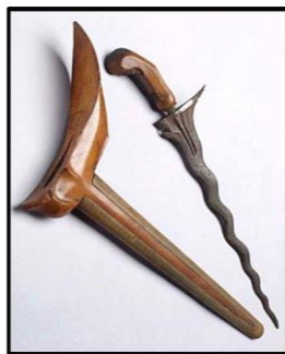
Gambar 4: Keris Jawa