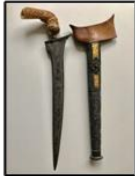
Gambar 2: Keris Semanjung