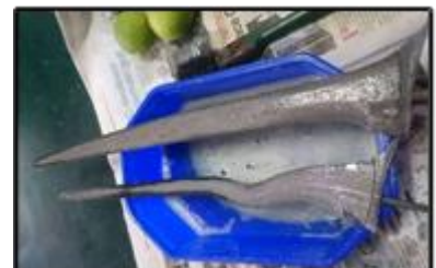
Gambar 16: Mencuci keris bersama sabun