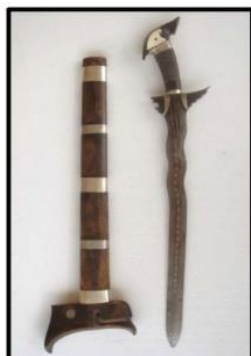
Gambar 8: Keris Sundang