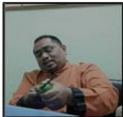
Gambar 14: Cara menggosok keris dengan menggunakan limau

Setelah selesai dengan proses menggosok bilah keris pada buah limau, siram air pada bilah tersebut untuk membuang sisa-sisa limau pada keris. Selepas itu, lapkan keris tersebut menggunakan kain. Sediakan bekas kemenyan terlebih dahulu. Mula hidupkan bara api dengan menggunakan arang dan pemetik api. Setelah bara sudah terhasil, letakkan kemenyan ke dalamnya. Sebelum lahirnya pelbagai pewangi campuran, masyarakat Melayu mengamalkan penggunaan kemenyan sebagai alat pewangi sejak zaman berzaman. Ia juga turut menjadi sebahagian daripada tradisi orang Arab dengan menggunakan kemenyan atau lebih dikenali bagi masyarakat Arab sebagai ' bukhoor ' untuk alat pewangi. Getah daripada kemenyan tersebut akan menjadi sebagai pelapik untuk memastikan bilah keris bertahan atau mengelakkannya daripada cepat rosak. Hayunkan bilah keris ke arah kepulan asap yang dihasilkan daripada bekas kemenyan tersebut dan ulang langkah itu sehingga bilah keris kering. Hasil daripada proses tersebut membuatkan bilah keris menjadi kering dan juga wangi dengan bauan daripada kemenyan.