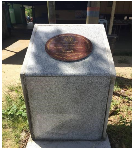
Gambar 17: Monumen Pengiktirafan daripada Jabatan Warisan Negara