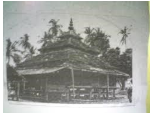
Gambar 2: Foto Lama Masjid Lama Kampung Tuan