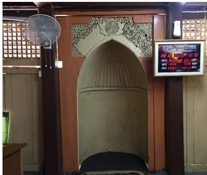
Gambar 12: Dinding Mihrab masjid