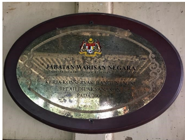
Gambar 18: Plak Kerja Konservasi Bangunan oleh Jabatan Warisan Negara