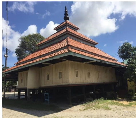
Gambar 3: Foto terkini Masjid Lama Kampung Tuan