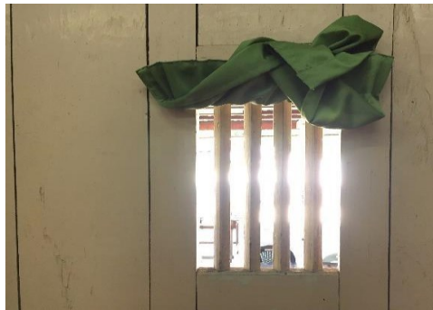
Gambar 9: Bukaan tingkap yang rendah dan kecil

Bukaan tingkap yang dimiliki oleh Masjid Lama Kampung Tuan adalah banyak iaitu berjumlah 14 tingkap tetapi dalam skala yang kecil. Ia berukuran 30 cm lebar dan 45 cm tinggi. Selanjutnya, pada tingkap tersebut terdapat empat batang kayu halus sebagai jaring pada setiap belahan tingkap. Bagi mengawal jumlah cahaya yang memasuki masjid melalui tingkap ini, kain atau tirai digunakan bagi menutupi tingkap itu. Tambahan itu, Mihrab juga adalah satu elemen yang terdapat di masjid ini. Ia dibina menggunakan kayu balak yang dibuang isi – isi dalamnya. Kayu balak tersebut dijadikan sebagai mimbar masjid tanpa sebarang penyambungan tetapi ia dibelah menjadikan konsep atau bentuknya separa bulat. Tinggi mimbar tersebut lebih kurang 5 kaki dengan ketebalan dinding 4 inci.