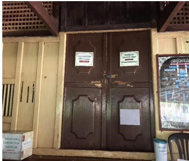
Gambar 11: Pintu utama masjid