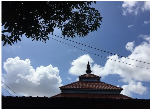
Gambar 8: Keadaan atap yang terkini