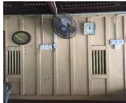
Gambar 10: Dinding masjid