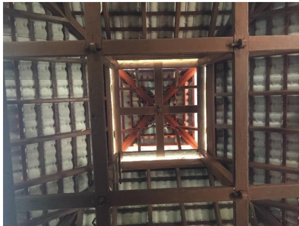
Gambar 7: Menunjukkan rangka pemegang atap