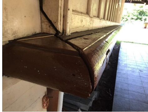
Gambar 6: Kedudukan ketinggian lantai yang berbeza antara lantai masjid