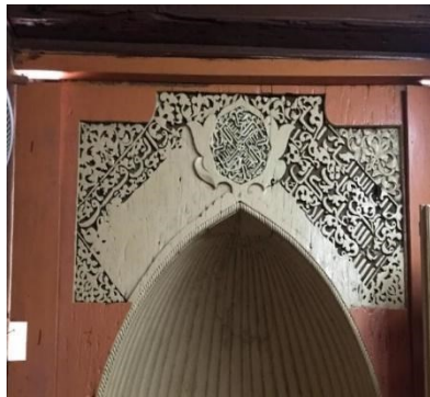
Gambar 13: Ukiran pada dinding Mihrab

ukiran ayat- ayat suci al quran yang tidak lengkap. Tetapi ukiran tersebut tidak dapat di baca dan difahami oleh sesiapa lagi sehingga sekarang. Motif hasil daripada ukiran tersebut tidak diketahui berikutan ukiran itu diukir sekali semasa pembinaan masjid tersebut tetapi keadaan ini menyebabkan pembaca yang membaca ukiran tersebut menjadi tertarik untuk mengetahui dengan lebih mendalam makna ukiran al quran itu.