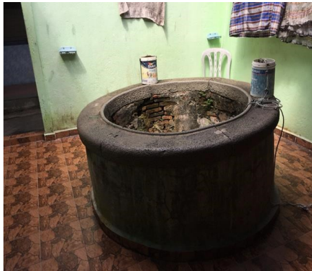
Gambar 15: Telaga Masjid Lama Kampung Tuan