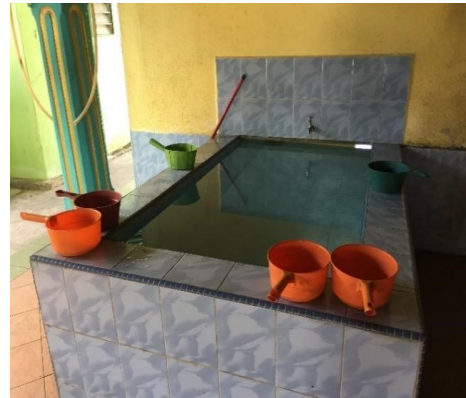
Gambar 16: Kolah kecil