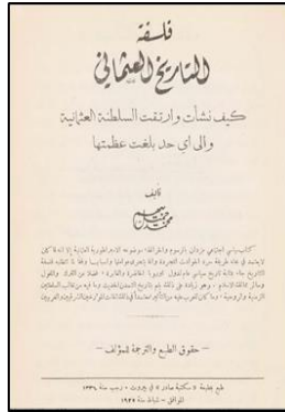
Gambar 1: Halaman muka hadapan karya Falsafah al-Tarikh al-'Uthmani cetakan Maktabah Shadir di Beirut pada tahun 1925.