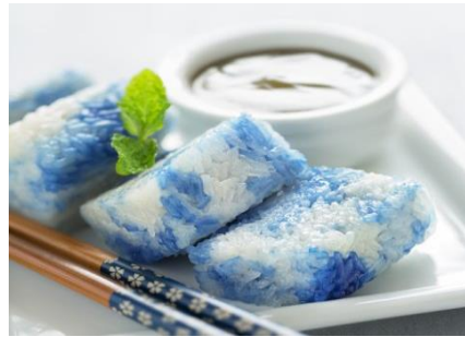
Gambar 4: Pulut tekan

Dari aspek pakaian pula, baju tradisional masyarakat Baba Nyonya dikaitkan dengan masyarakat Melayu kerana rupanya yang mirip dengan pakaian kaum Melayu. Pakaian tradisional ini berbeza bagi generasi muda dan tua. Pakaian tradisional masyarakat Baba Nyonya bagi kaum perempuan muda ialah baju kebaya pendek yang mempunyai sulaman dan corak flora dan fauna seperti corak bunga, corak ombak dan corak burung merak. Baju kebaya ini akan dipakai bersama kain sarung berserta aksesori tambahan iaitu tiga pasang kerongsang manakala rambut mereka akan disanggul tinggi. Baju kebaya ini dikatakan serupa seperti pakaian orang Indonesia. Bagi kaum wanita yang lebih tua, baju tradisional mereka dipanggil Baju Panjang iaitu baju kebaya yang lebih labuh. Baju Panjang ini berkolar tinggi yang menutup bahagian dada dan labuhnya akan melebihi paras lutut. Selain itu, baju ini mestilah tidak mempunyai potongan yang mengikut bentuk badan dan dipadankan dengan berkerongsang rangkai serta kain sarung. Kebiasaannya, kaum wanita akan memakai kasut manik untuk digayakan bersama baju kebaya mereka. Bagi kaum lelaki masyarakat Baba Nyonya pula, mereka hanya berpakaian ringkas tanpa mempunyai baju tradisional yang spesifik. Menurut Chin Neo (2019), terdapat sebahagian masyarakat Baba Nyonya yang turut memakai pakaian kaum Cina seperti samfoo ketika berada di rumah serta cheongsam apabila menghadiri sesuatu majlis.