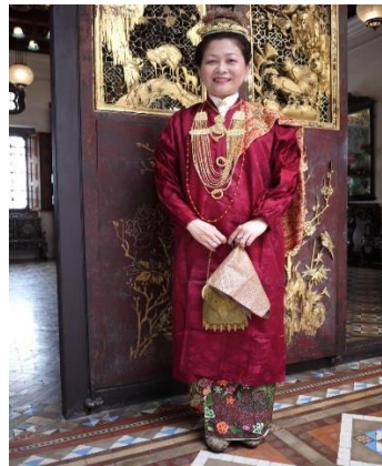
Gambar 6: Baju panjang masyarakat Baba Nyonya

Dari segi kesenian bagi masyarakat Baba Nyonya, mereka mempunyai tarian tradisional yang dikenali sebagai tarian ronggeng. Tarian ronggeng ini menyerupai tarian joget bagi kaum Melayu. Tarian ronggeng ini disertai oleh perempuan dan lelaki tanpa mengira tua atau muda. Ahli kumpulan untuk sesuatu tarian ronggeng kebiasaannya adalah sebanyak dua puluh orang dan dipersembahkan dalam lima hingga sepuluh minit. Masyarakat Baba Nyonya di Melaka mempunyai kumpulan ronggeng mereka sendiri yang berada di bawah Persatuan Peranakan Cina Melaka di mana mereka akan mempersembahkan tarian ini ketika sesuatu majlis berlangsung sebagai contoh pada Hari Melaka. Tarian ronggeng ini mampu menunjukkan budaya masyarakat Baba Nyonya melalui peralatan yang digunakan ketika membuat persembahan tersebut iaitu kipas, bakul dan payung yang merupakan barangan kraftangan buatan masyarakat Baba dan Nyonya itu sendiri. Selain itu, masyarakat Baba Nyonya turut mahir berperibahasa dan berpantun seperti kaum Melayu. Penggunaan pantun dalam kalangan Baba Nyonya sangat