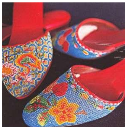
Gambar 8: Kasut manik

Pembuatan kraftangan dalam kalangan masyarakat Baba Nyonya tidak berkembang luas dan mereka hanya tertumpu kepada pembuatan kasut manik. Kain yang digunakan adalah dari jenis polister yang mempunyai ketebalan yang agak tinggi. Manik yang digunakan dalam pembuatan kasut tersebut diimport dari Jerman dan Itali. Manik-manik yang diimport ini adalah sangat halus dan susah untuk didapati pada zaman sekarang. Kasut manik mempunyai pelbagai corak yang menarik dan sesuai untuk digayakan sama ada ketika waktu kasual atau untuk menghadiri sesuatu majlis. Pembuatan kasut manik ini adalah bergantung dengan pembuatan tangan secara keseluruhannya tanpa menggunakan mesin.