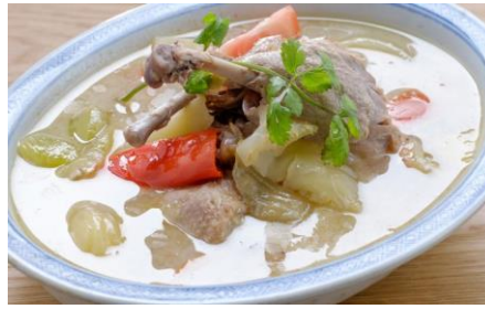
Gambar 3: Itik tim