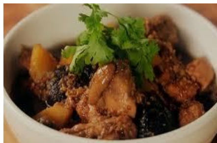
Gambar 2: Ayam pongteh