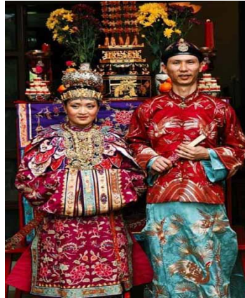
Gambar 1: Pengantin masyarakat Baba Nyonya

sekali, kedua-dua keluarga dari pihak lelaki dan perempuan akan makan bersama sebagai satu proses untuk menjalinkan hubungan yang baik antara mereka. Selain itu, salah satu keunikan masyarakat ini juga, mereka diberi pilihan untuk memilih etnik jika ibu bapa mereka berkahwin antara etnik yang berbeza.