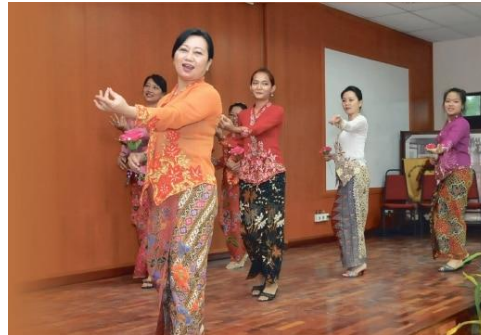
Gambar 7: Tarian ronggeng

disukai dan mereka menggunakan lagu Dondang Sayang sebagai medium dalam berbalas pantun sesama mereka.