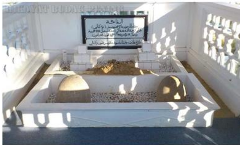
Rajah 3 :Makam Tok Kenali