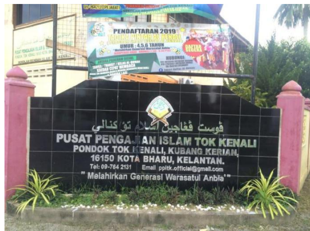
Rajah 4 : Pusat Pengajian Islam Tok Kenali

Pondok Tok Kenali ditubuhkan pada tahun 1909 oleh Tok Kenali sendiri atau nama sebenarnya Haji Muhammad Yusuf bin Ahmad pada tahun 1909 setelah beliau pulang daripada makkahatul mukaramah selepas guru kesayangan beliau meninggal dunia pada tahun 1908. Pondok Tok Kenali ditubuhkan pada 1909 dan sampai sekarang masih lagi beroperasi. Pondok tersebut masih beroperasi tetapi dengan cara dan sistem yang berbeza. Pondok tersebut terletak di Kampung Kenali, Kubang Kerian, Kelantan dan dinamakan sebagai Pusat Pengajian Islam Tok Kenali.