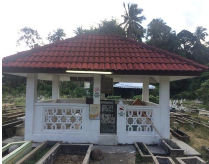
Rajah 2 : Makam Tok Kenali

iaitu 175 orang yang direkodkan oleh MAIK yang telah memiliki ataupun membuka pondok agama untuk menyebarkan ilmu agama Islam kepada orang ramai dan mungkin ramai lagi anak murid Tok Kenali yang membuka pondok tetapi tidak direkodkan oleh MAIK.