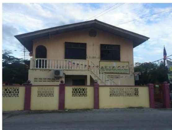
Rajah 5 : Pusat Pengajian Islam Tok Kenali