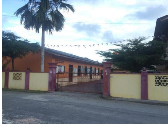
Rajah 6 : Pusat pengajian Islam Tok Kenali