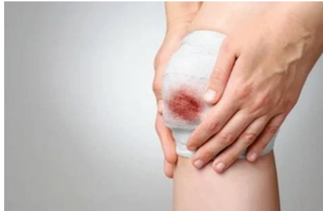
Gambar 1: Luka yang tidak sembuh dengan baik boleh mengakibatkan komplikasi serius