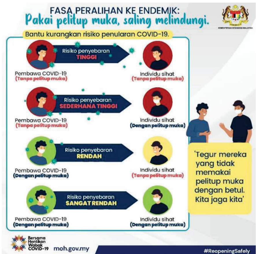
Gambar 3: Infografik pemakaian topeng muka.

Kesimpulannya, aspek komunikasi menjadi elemen terpenting bagi setiap individu dalam setiap situasi, setiap masa dan setiap tempat. Komunikasi visual memainkan peranan yang besar dalam membantu menyampaikan maklumat penting. Perhatian yang serius harus diambil dalam aspek komunikasi visual supaya ia mampu memberikan peranan yang berkesan. Tidak dinafikan bahawa komunikasi visual juga merupakan penyumbang terpenting kepada kawalan kesihatan dan penularan penyakit.