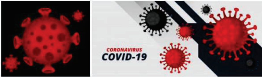
Gambar 2: Imej grafik mengenai Corona Virus/Covid-19

Menurut Miriam (2019), beberapa kajian mendapati visual ilustrasi amat berkesan dalam membimbing mereka yang kurang celik kesihatan, termasuk kanak-kanak dan individu di negara membangun.