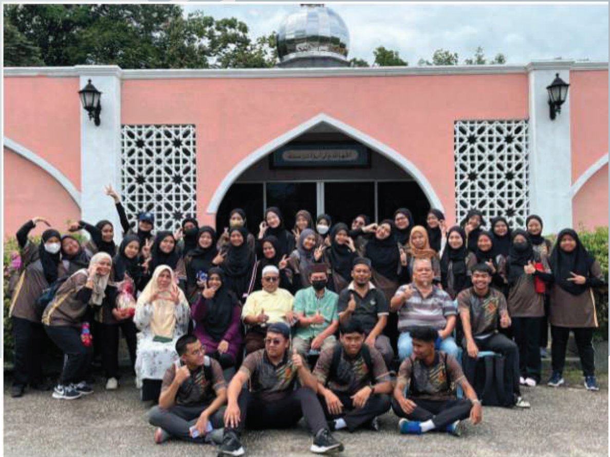
Sesi bergambar bersama Ahli Jawatankuasa Masjid Kampung Selaru dan Mahasiswa UiTM Cawangan Negeri Sembilan Kampus Seremban.