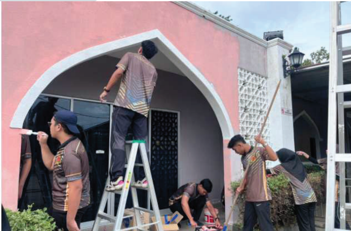
Mahasiswa mengecat kawasan luar Masjid Kampung Selaru, Kuala Pilah

Program diakhiri dengan sesi penyampaian cenderahati kepada jawatankuasa Masjid Kampung Selaru dan wakil mahasiswa UiTM Cawangan Negeri Sembilan Kampus Seremban serta sesi bergambar bersama semua jawatankuasa dan mahasiswa terlibat. Program ini memberikan pengalaman yang sangat berharga untuk mahasiswa yang tidak ternilai dengan wang ringgit sekaligus menjadi pemangkin untuk mahasiswa terus melibatkan diri terutamanya dalam program-program kemasyarakatan.