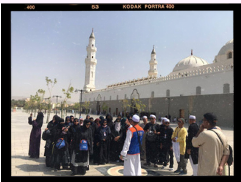
Ana merenung ke tapak telaga yang mana dikatakan cincin Saidina Usman RA terjatuh ke dalamnya dan tidak dapat dijumpai (perkarangan masjid Quba).

Diringkaskan cerita, ibadah Sa'ei ana lengkap diakhiri dengan bertahlul. Malam tersebut sambil berehat sebelum terlelap anak ana sempat mengamati aplikasi tik-tok tentang perkara yang perlu diberi perhatian dan berhati-hati ketika di tanah suci kerana lambakan scammer yang bijak mengatur strategi. Terlintas di skrin telefon bimbitnya 'Do you speak English'. kami berdua ketawa serentak mengenangkan kejadian di siang hari. Walaupun ada lagi beberapa kejadian yang boleh diambil iktibar tetapi ana tidak muatkan di sini. Yang penting luruskan niat bulatkan tekad lakukan yang wajib dan sunat dan pulang ke tanah air dengan selamat. Boleh dikatakan kembara ana kali ini lebih diwarnai dengan kisah-kisah kehidupan di sekitar dua tanah suci, Madinah dan Mekkah. Antaranya peminta sedekah kanak-kanak, jurujual yang memaksa, pemandu yang kurang berhemah, jemaah tidur nyenyak waktu solat sebaliknya bangun segar bugar dan berbual sebaik sahaja semua jemaah selesai memberi salam dan banyak lagi. Kesemua kejadian yang dianggap mustahil boleh sahaja berlaku dengan kehendak Allah. Setiap satunya ada hikmah yang boleh difikirkan bagi mereka yang diberi kesempatan untuk melalui pengalaman-pengalaman ringan tetapi banyak pengajaran. Selamat tinggal bumi Allah tercinta, moga ana dijemput-Nya ke sana semula, Amiin.