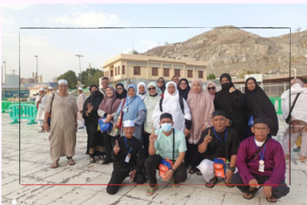
Berlatarkan rumah kelahiran Rasulullah (kini dijadikan perpustakaan yang sederhana sahaja), bersebelahan bukit Safa Warwah

Zulkifli, M.A. (2017, 8 Sep). Ibadat Saie Sempena Memperingati Kisah Siti Hajar. Sirah Nabi. : https://sirahnabi-nabi.blogspot.com/2017/09/ibadat-saie-sempena-memperingati-kisah.html