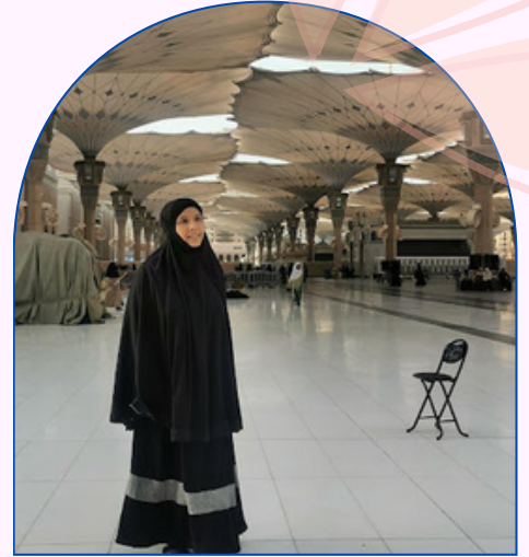
Suasana hening setelah subuh di persekitaran masjid Nabawi

Madinah merupakan kota suci kedua umat Islam yang dituntut untuk kita menziarahinya. Kota Madinah juga merupakan tempat berhijrah Rasulullah S.A.W, lokasi yang dipilih dan diperintahkan oleh Allah supaya Rasulullah S.A.W berhijrah dan diterima oleh penduduk asal kaum Ansar di Madinah. Madinah juga merupakan kota yang Rasulullah S.A.W cinta kepadanya sebagaimana hadith yang diriwayatkan daripada Aisyah R.Anha, bahawa Rasulullah S.A.W berdoa yang bermaksud: Ya Allah jadikan kami mencintai Madinah, seperti cinta kami kepada Mekkah atau lebihkan lagi dari Mekkah. Ya Allah berkatilah timbangan dan ukuran kami (Riwayat al-Bukhari, 1889).