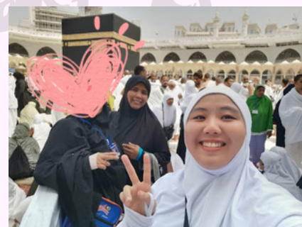
Bergambar setelah berjaya menyentuh Ka'bah, semestinya setelah selesai tawaf sunat. Tutup muka hamba Allah sebab tanpa kebenaran.

Setelah memasuki pusingan ketiga, selepas melepasi bukit Marwah dan sebelum menjejaki laluan lampu hijau, seperti pusingan-pusingan lainnya, ana dan anak terus berselawat atau membaca doa-doa amalan harian yang ringkas. Tiba-tiba rentak Sa'ie ana terganggu dengan satu sapaan berhemah. 'Do You Speak English?', sapa wanita muda yang jelita parasnya di mata ana. Kulitnya putih mulus, wajahnya bagaikan patung, hidung mancung bermata coklat, rambut keritingnya sedikit terdedah di bahagian dahi yang menambah keelokan rupanya. Anak yang berjalan di sebelah ana juga seakan memperlambatkan langkah mengamati soalan yang diajukan oleh wanita muda tadi.