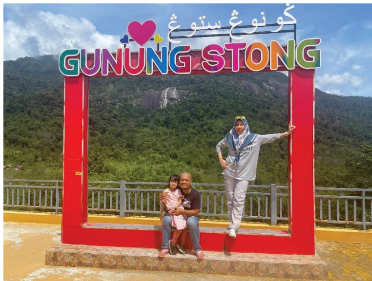
Gambar 3: Kenangan di mercu tanda Gunung Stong