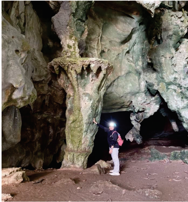
Gambar 2: Memori di Gua Keris