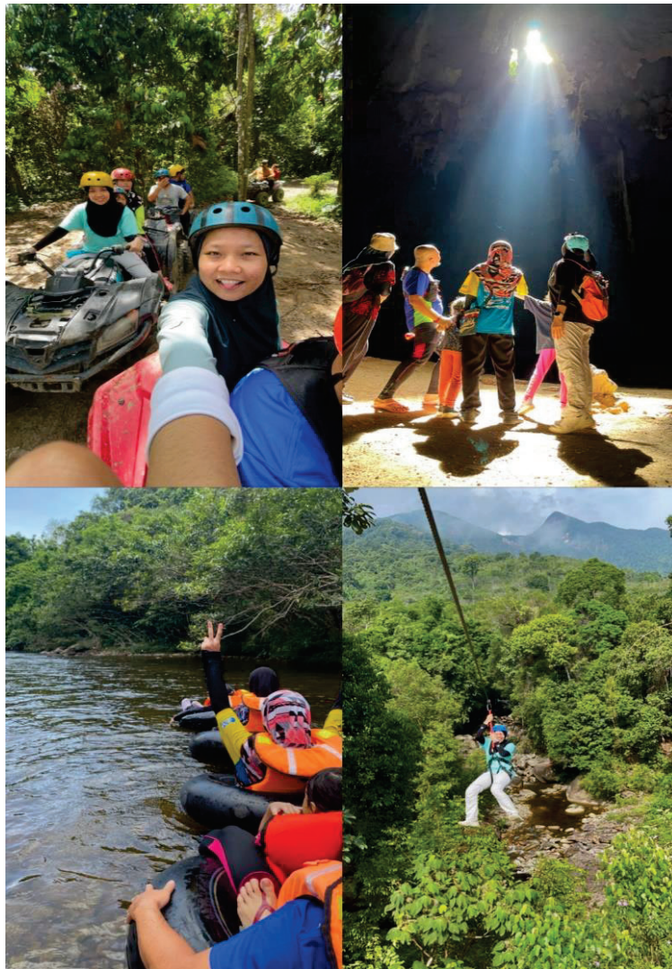
Gambar 1: Aktiviti riadah dan ekstrim yang disertai oleh penulis bersama ahli keluarga

tanda Gunung Stong sebelum pulang sebagai bukti kunjungan anda ke sini selain memahat kenangan indah dalam bentuk gambar dan memori.