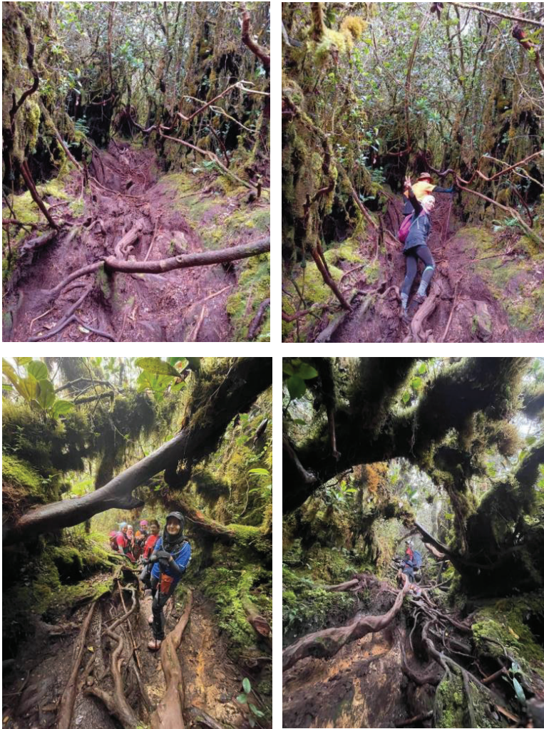
Gambar 4: Keindahan hutan berlumut sepanjang trek pendakian ke puncak Gunung Yong Belar.

Akhirnya selepas lebih kurang 8 jam mendaki, kesemua ahli kumpulan kami berjaya sampai ke puncak, dengan pendaki terakhir tiba lebih kurang pada pukul 1 petang. Puncak Gunung Yong Belar tidaklah terlalu luas tetapi menyajikan pemandangan indah Banjaran Titiwangsa jika cuaca cerah. Kami tidak bernasib baik kerana keadaan sekeliling pada hari tersebut adalah berkabus, walaupun dengan matahari yang bersinar.