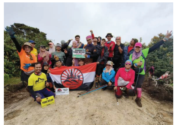
Gambar 5: Meraikan kejayaan berjaya tiba ke puncak Gunung Yong Belar.

Gunung ini juga mempunyai hutan dan air terjun yang cantik dan bebas dari pacat dan nyamuk. Akan tetapi, sepanjang pendakian naik dan turun, ada beberapa ketika kami melalui kawasan lereng gunung dan dari situ kami dapat melihat dari jauh beberapa kawasan hutan bersebelahan yang telah digondolkan, mungkin untuk dijadikan kawasan pertanian. Walaupun atas alasan apa sekalipun, bagi pendaki dan pencinta hutan seperti kami, pemandangan tersebut adalah sangat menyedihkan. Kami cuma mampu berharap agar aktiviti pembersihan hutan tersebut dijalankan dengan kebenaran pihak berkuasa dan dilakukan secara terkawal agar kelestarian hutan kita dapat terus dipelihara untuk dinikmati oleh generasi akan datang.