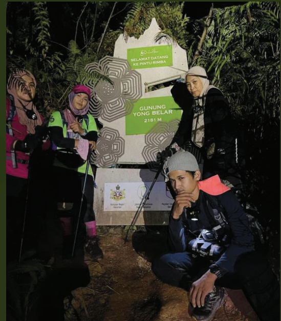
Gambar 1: Papan tanda di pintu rimba Gunung Yong Belar.

Biasanya para pendaki akan meletakkan kenderaan di kawasan meletak kenderaan khusus berhampiran Masjid Long Tan ataupun juga dikenali sebagai Masjid Keputeraan di Lojing Highlands. Dari situ pendaki akan menaiki pacuan 4 roda sejauh 6 km untuk ke tempat permulaan yang terletak di dalam kawasan sebuah kebun sayur. Perkhidmatan pacuan 4 roda ada disediakan oleh pemilik kebun sayur tersebut.