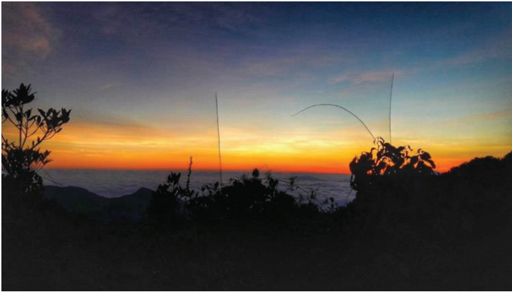
Gambar 2: Suasana ketika matahari terbit dan kepulan awan (yang dipanggil “awan karpet” oleh para pendaki) dilihat dari salah satu puncak tipu.

Bentuk trek sebegini juga menyebabkan ketinggian yang perlu didaki sebenarnya adalah melebihi 1,000 meter (lebih 1,500 meter mengikut catatan dari smartwatch kami). Selain itu, treknya juga amat becak dan berlumpur serta dipenuhi akar-akar kayu berselirat, menjadikan perjalanan mendaki dan menurunya amat memenatkan. Walau bagaimanapun, semua kepenatan pendakian tersebut biasanya berbaloi dengan keindahan hutan yang disajikan sepanjang trek ke puncak.