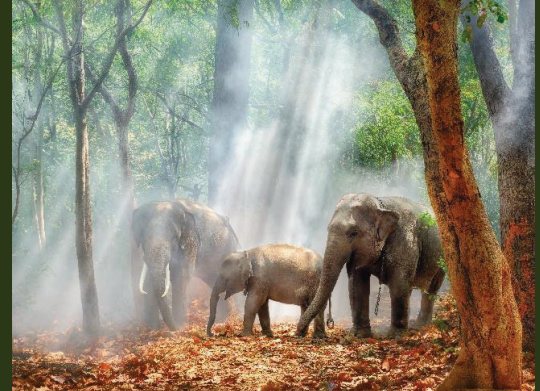
Gambar 1: Atas; Gajah Asia. Bawah; Sekumpulan gajah termasuk gajah yang masih kecil. Dapat dilihat gading pada seekor gajah yang terdedah kepada ancaman pemburuan haram.