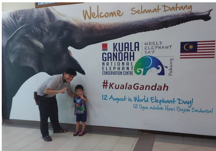
Gambar 2: Kunjungan penulis ke Pusat Konservasi Gajah Kebangsaan Kuala Gandah di Temerloh, Pahang pada Julai 2022. Pusat ini menjadi tumpuan pelancong dalam dan luar negara yang berminat untuk mengetahui lebih lanjut mengenai mamalia darat terbesar ini.

Konflik manusia-haiwan semakin meningkat kerana interaksi yang lebih kerap antara gajah dan manusia. Gajah-gajah yang memasuki kawasan pertanian atau perkampungan boleh merosakkan tanaman dan harta benda, justeru mencetuskan ketidakpuasan hati penduduk tempatan. Gajah sebagai mamalia darat terbesar sudah semestinya dianggap berbahaya terhadap keselamatan penduduk setempat. Ini boleh menyebabkan berlaku tindakan pencegahan atau penyingkiran haiwan, lebih membimbangkan lagi, pembunuhan secara tidak berkesan dan seringkali tidak berperikemanusiaan.