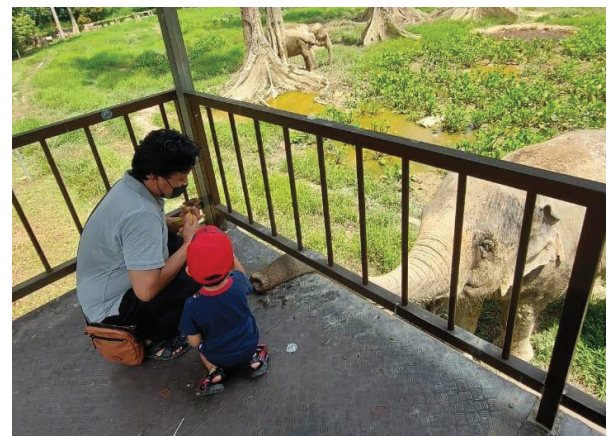
Gambar 4: Pelancong dibenarkan untuk berinteraksi Bersama gajah-gajah di sana seperti aktiviti memberi makan dan mendekati mereka bagi melatih kedua pihak mendalami kepentingan untuk membanteras konflik haiwan-manusia.