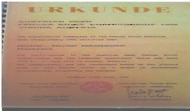
Gambar 8: Sijil Kejohanan Terbuka Pencak Silat di Vienna, Austria pada 1992