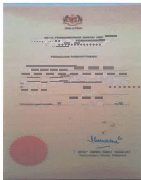
Gambar 2: Sijil Pendaftaran Pertubuhan Seni Silat Empat Kelantan