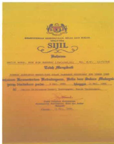
Gam.bar 4: Sijil jurulatih wasit/juri silat olahraga peringkat Zon Timur 1985