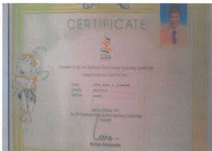
Gambar 6: Sijil penghargaan sebagai jurulatih silat untuk Sukan SEA (South East Asian), 1997