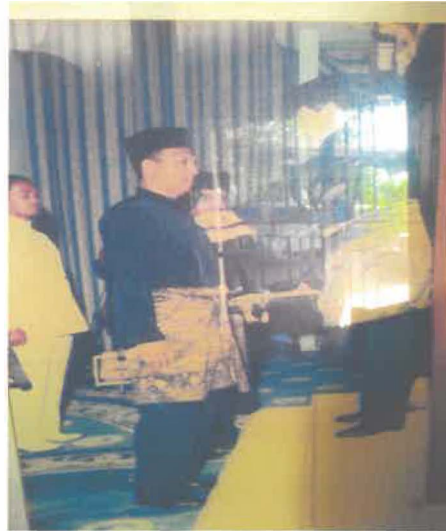
Gam.bar 3: Anugerah Darjah Setia Mahkota Yang Amat Terbilang daripada Sultan Ismail II Ibni Almarhum Sultan Yahya Petra pada tahun 1995