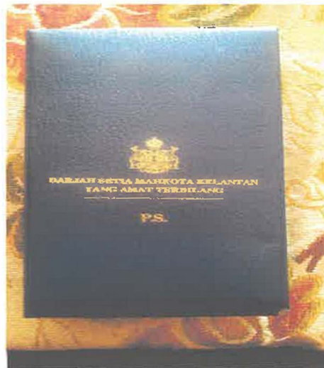
Gambar 1: Darjah Setia Mahkota Kelantan (P.S)