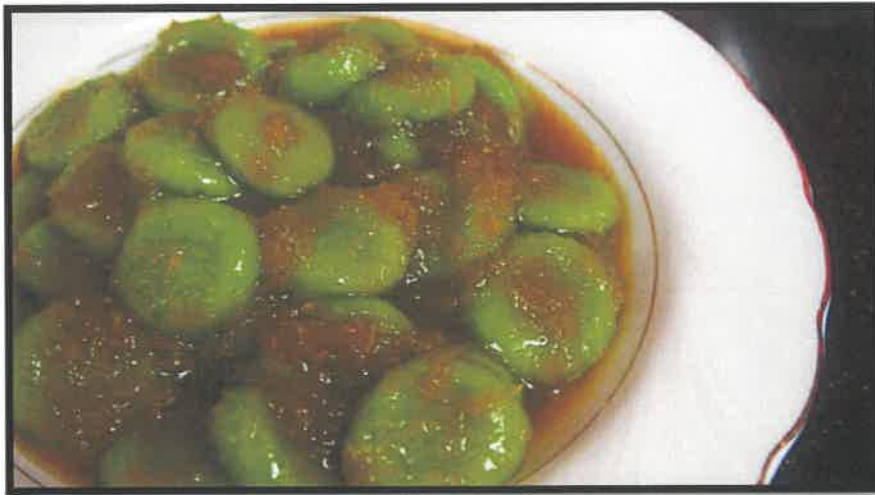
Gambar 2 Kuih Puteri Mandi Dengan Gula Melaka