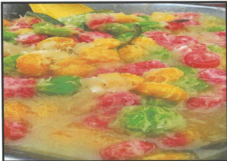
Gambar 3 Kuih Puteri Mandi Dengan Air Gula