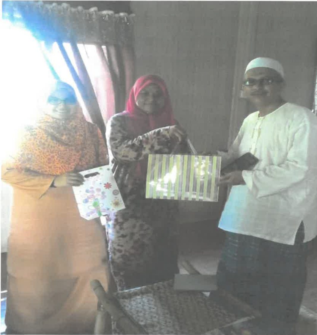
ii. Pemberian cenderamata kepada tokoh.