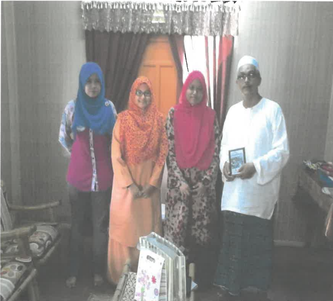
i. Gambar bersama tokoh selepas selesai sesi temuramah.