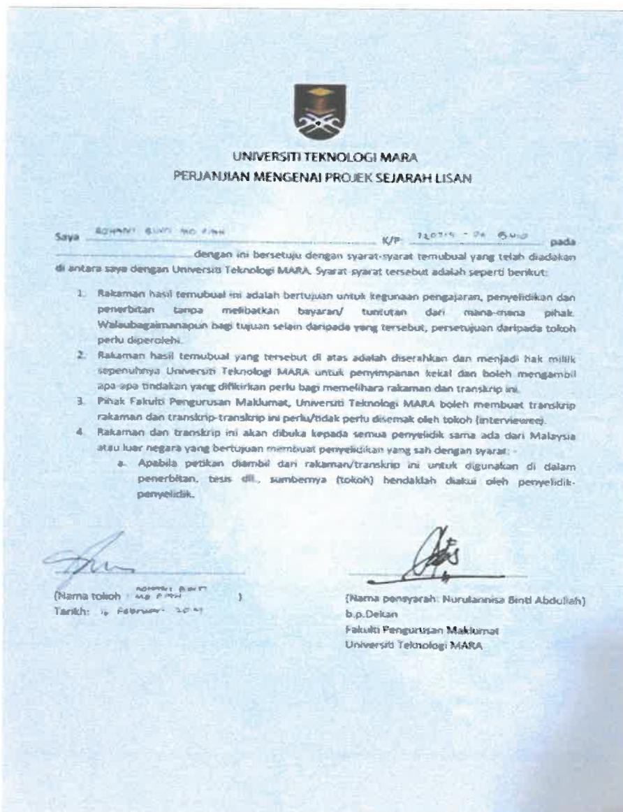
Gambar 1: Surat Perjanjian