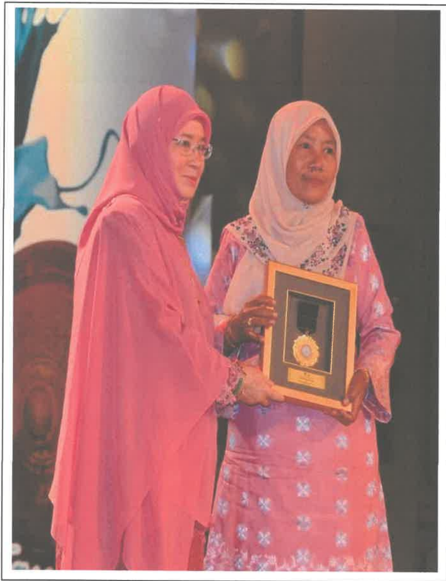
Gambar 2: Penerimaan Anugerah Usahawan Kraf Wanita