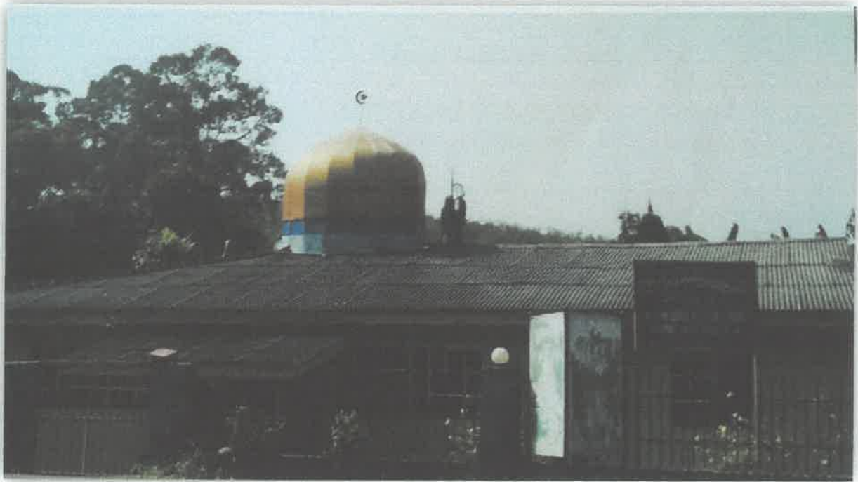
Masjid Tebing Tinggi