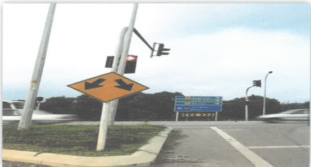
Jalan Highway Simpang Ke Kampung Tebing Tinggi.