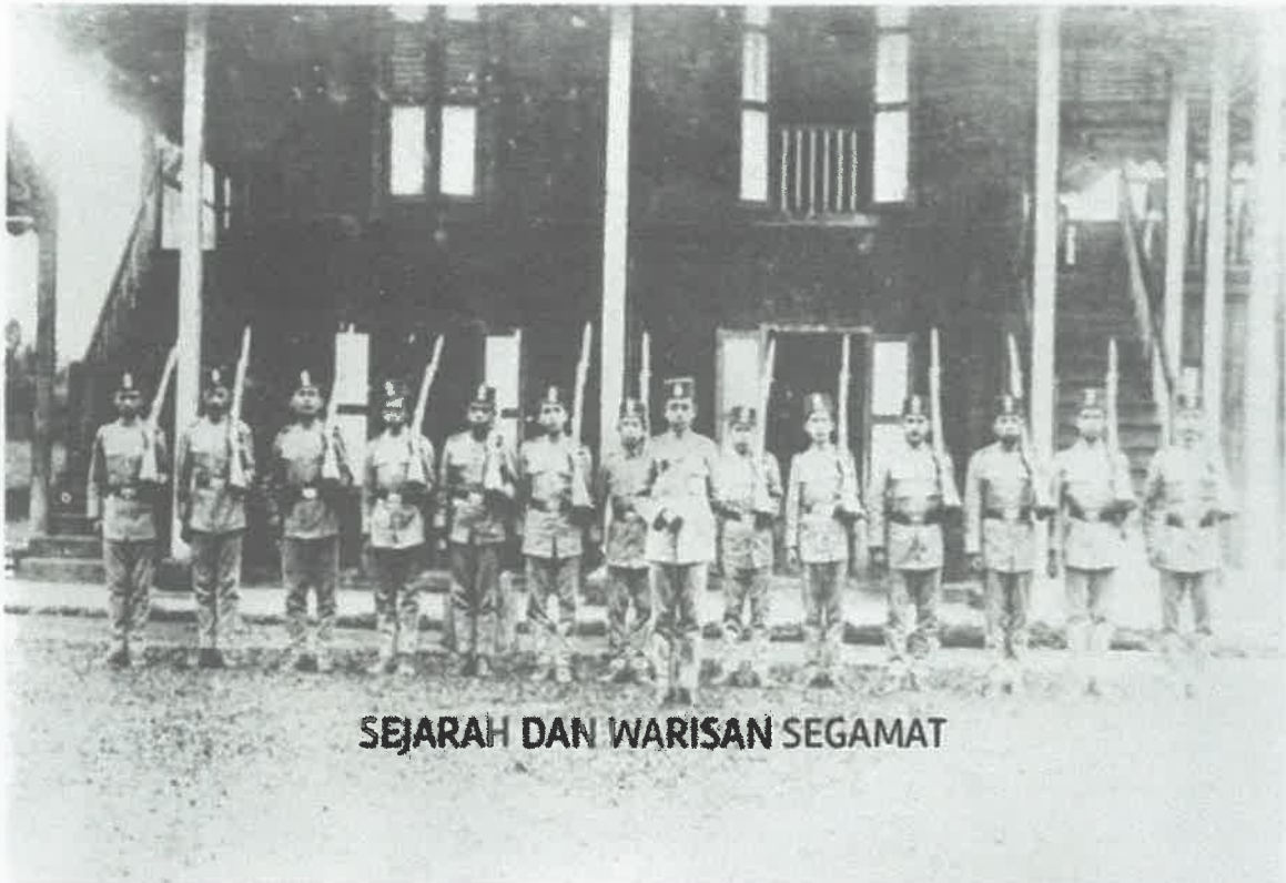
SEJARAH DAN WARISAN SEGAMAT

Bertuan Kehormatan Polis Daerah Segamat dalam tahun 1917. Di hadapan arkib oleh Inspektur Gila Awang.