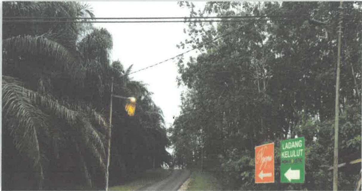
Ladang Kelulut Kampung Tebing Tinggi.