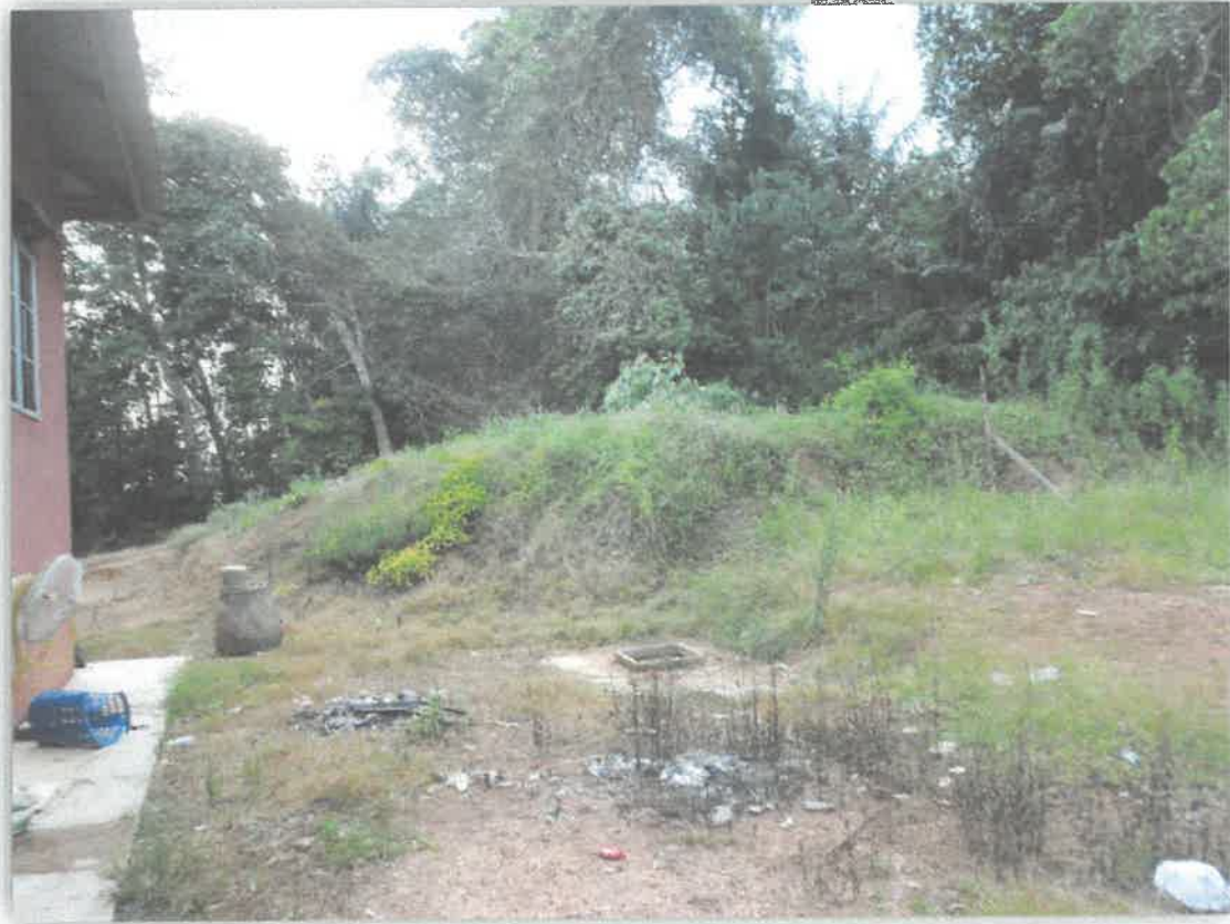
Bekas Tapak Rumah Pasong (Balai Polis) Segamat (Kg.Tebing Tinggi.