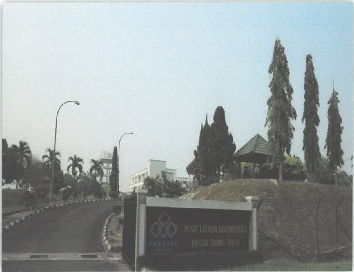
Pusat Latihan dan Rekreasi FELCRA (PLRF) Tebing Tinggi .