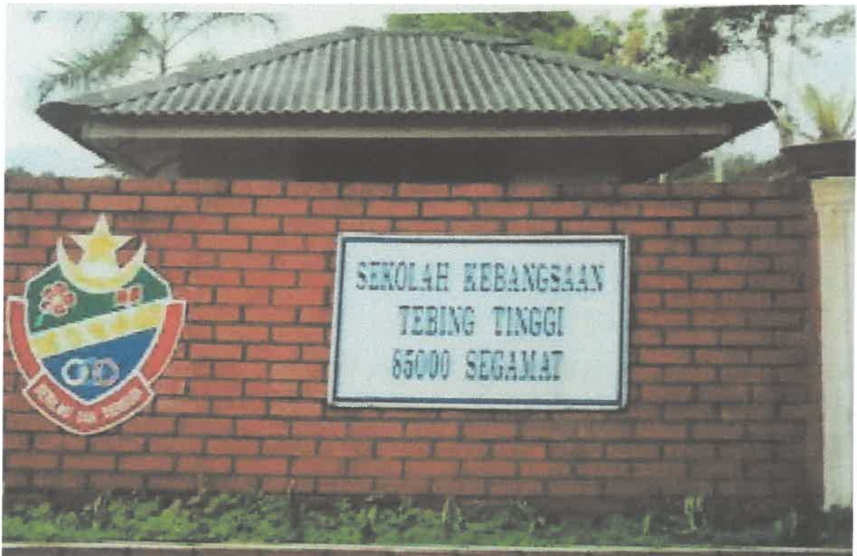
Sekolah Kebangsaan Tebing Tinggi.