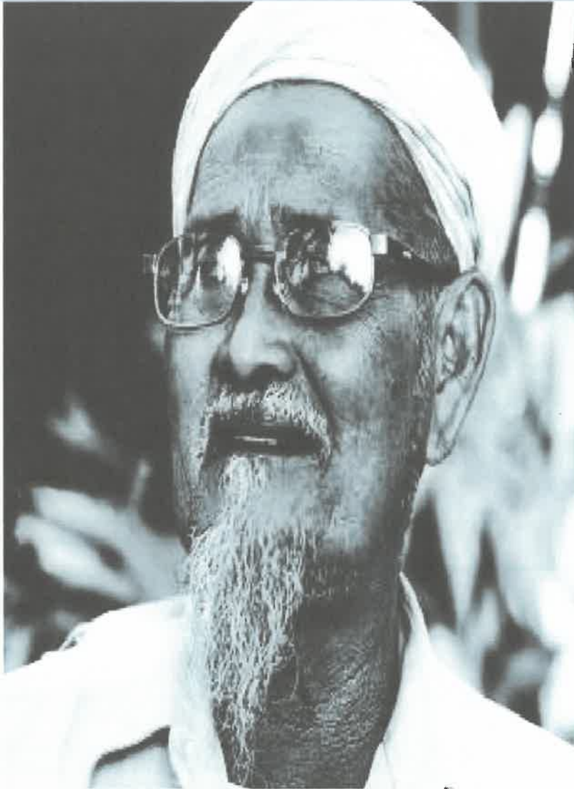
Gambar 3: Tok Janggut Pejuang Tanah Melayu