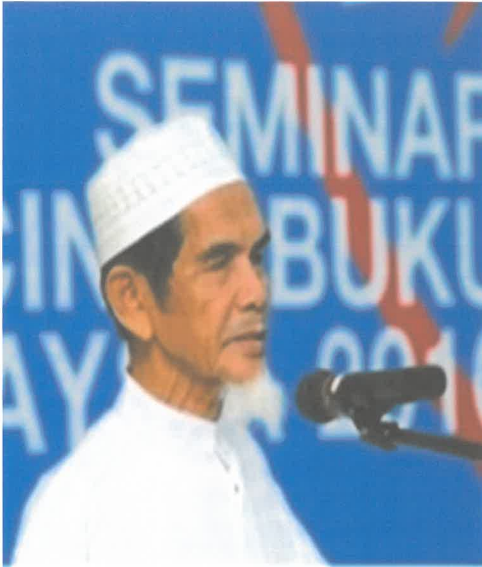
Gambar 2: Penulis Buku Ensiklopedia Unggul Doa Hajat Jampi Mujarrab Segala Penyakit Tanpa Ubat