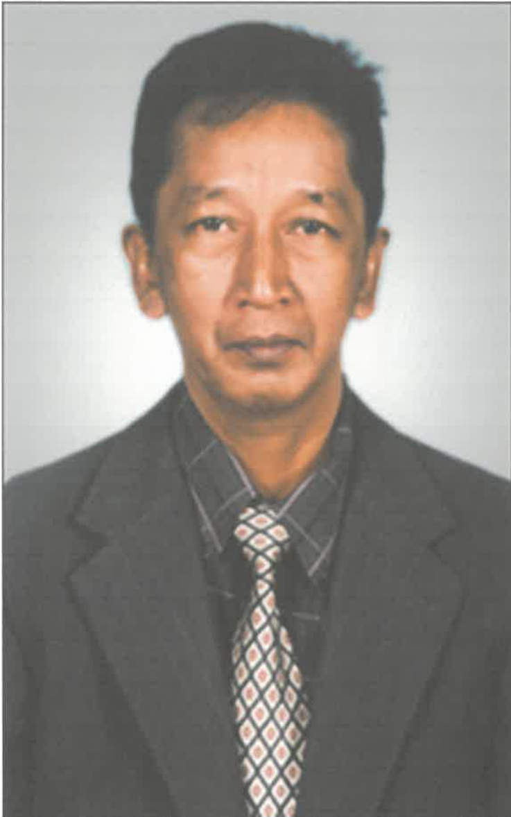
Gambar 1: Tokoh Pencerita