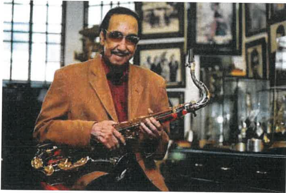
Gambar Rajah 3: Datuk Seri bersama saksofonnya