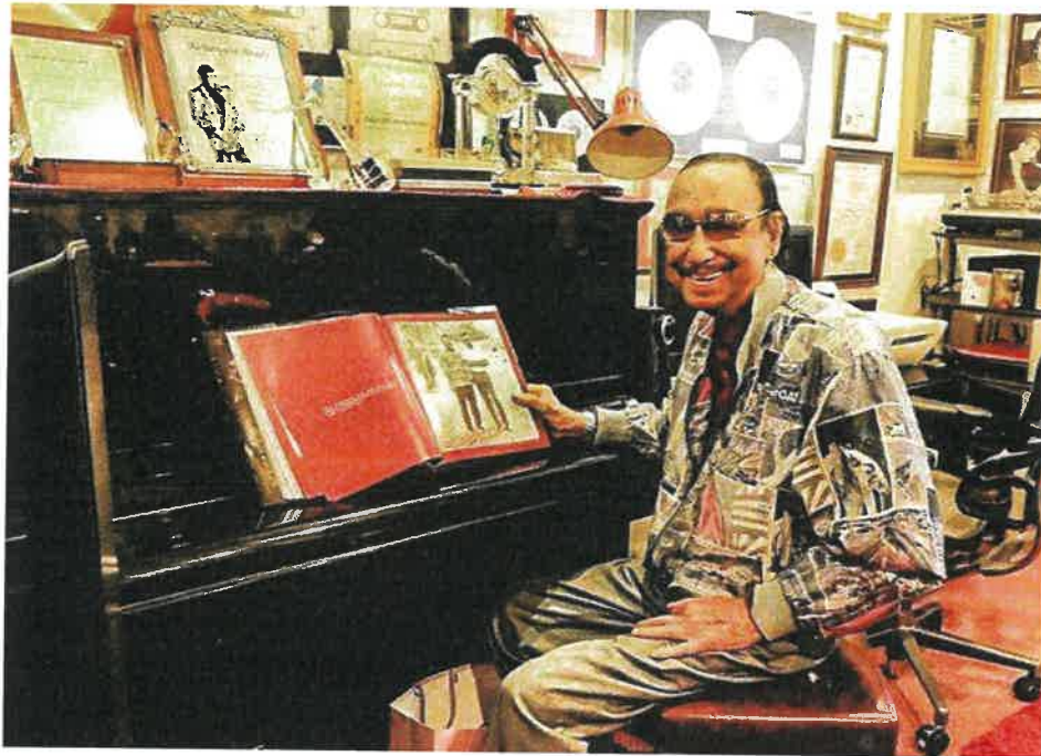
Gambar Rajah 4: Datuk Seri dalam bilik muziknya