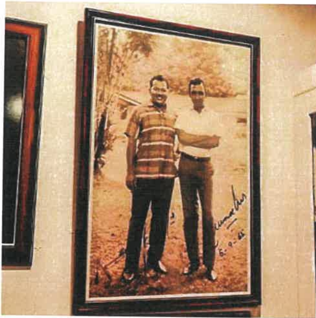
Gambar Rajah 1: Datuk Seri bersama sahabat baiknya, Tan Sri P.Ramlee