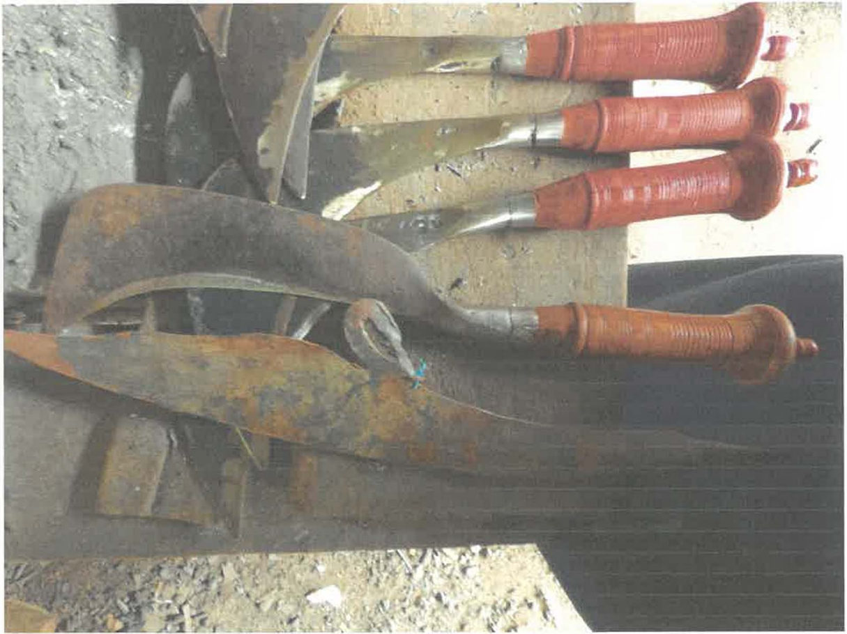
Gambar 3. Kewang