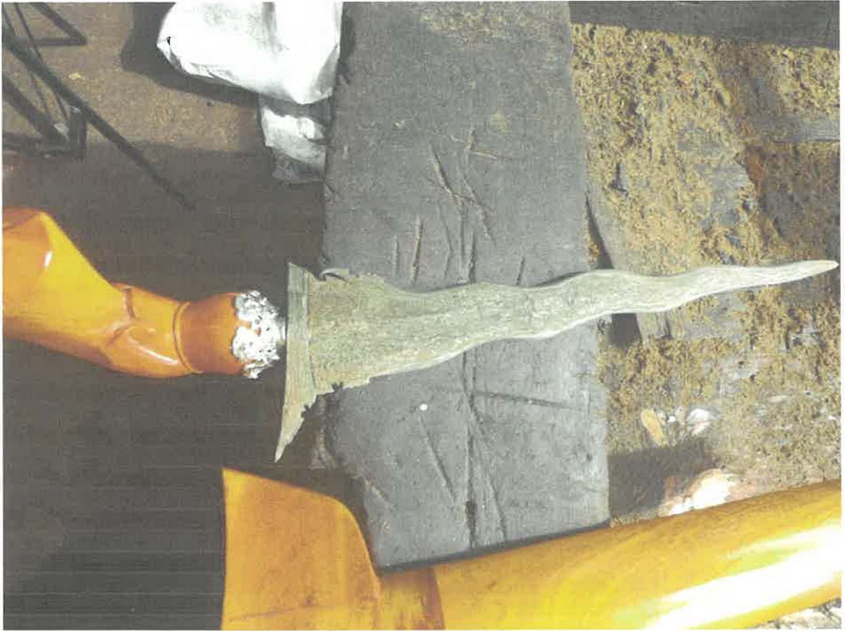
Gambar 1. Keris