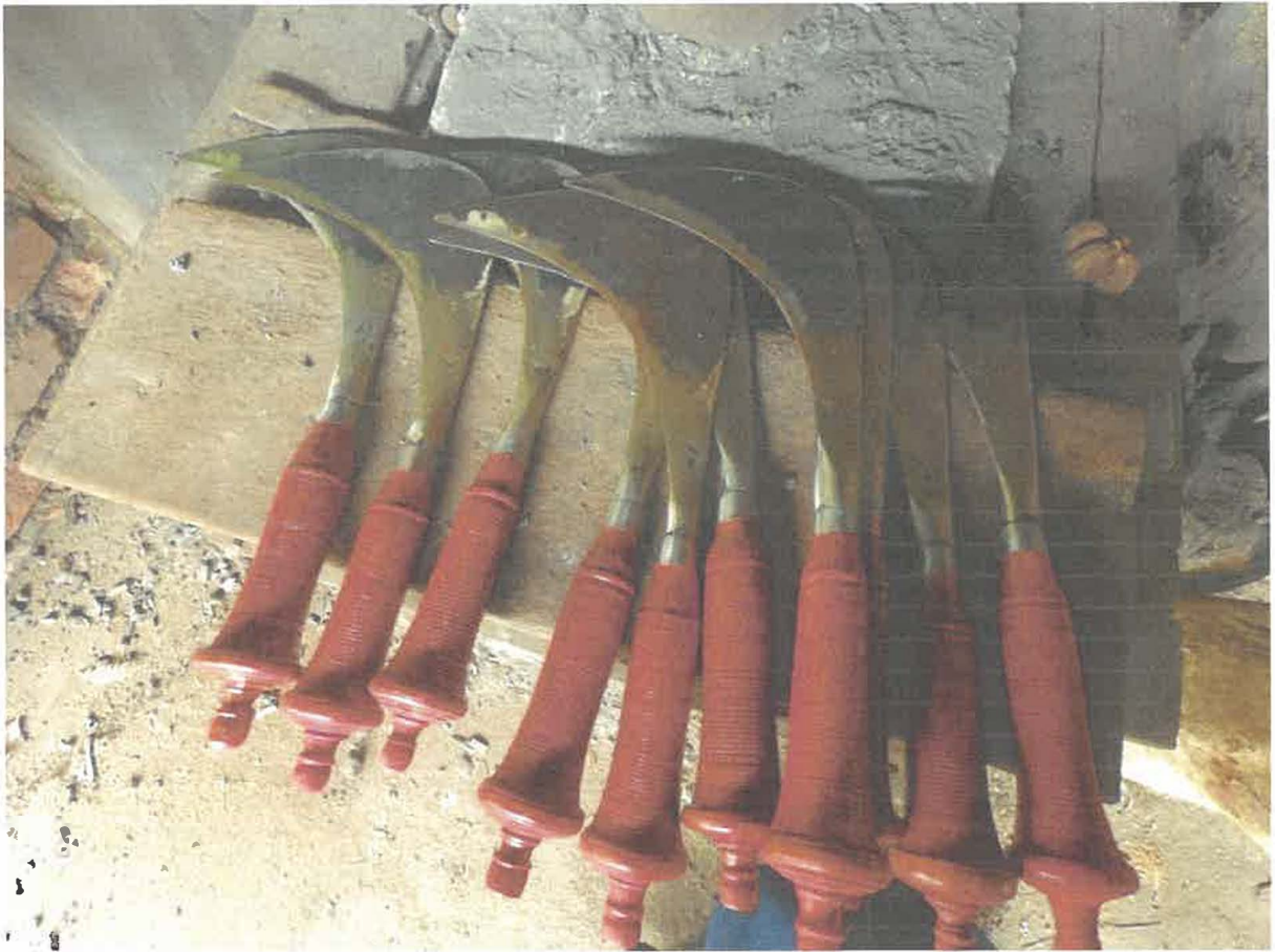
Gambar 2. Sabit Kuek