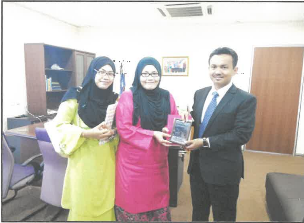
Gambar 1 : Selepas sesi temuramah bersama Y.B. Tuan Zaidy