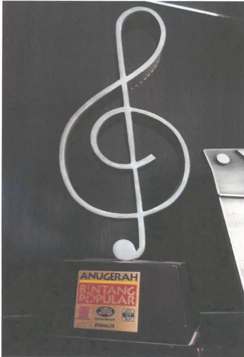
Anugerah Bintang Popular