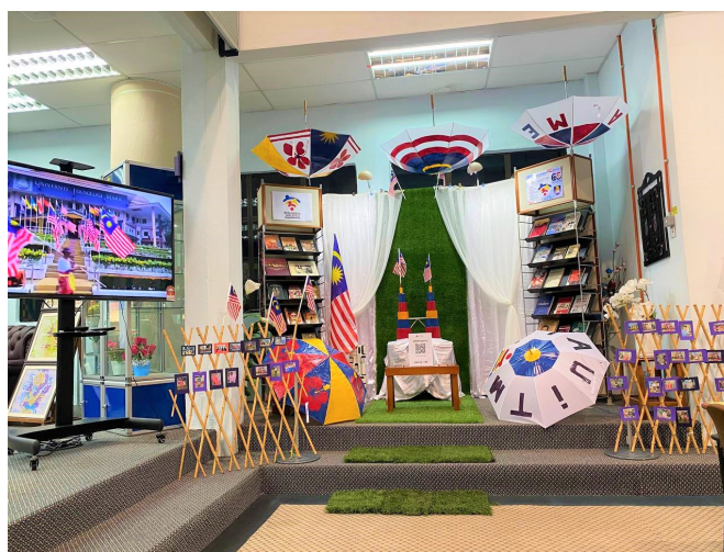
Gambar semasa penilaian oleh juri

Terima kasih diucapkan kepada semua staf PTA yang bersama-sama berganding bahu dan memberi kerjasama yang sepenuhnya semasa kerja-kerja menghias bahagian dijalankan. Semoga kemenangan berpihak kepada bahagian perpustakaan.