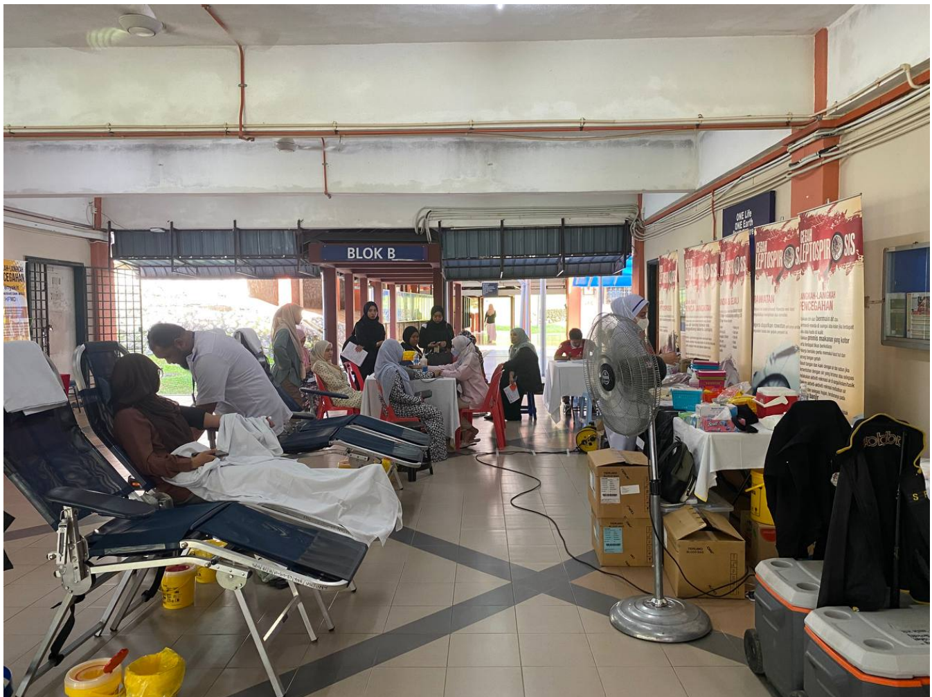
Gambar sekitar kempen derma darah oleh pihak Hospital Kuala Krai

Seminar ini telah mendapat sambutan yang menggalakkan dan komen yang positif daripada peserta fizikal serta maya di mana mereka menyatakan perkongsian daripada pembentang amat membantu dan menambah pengetahuan mereka.