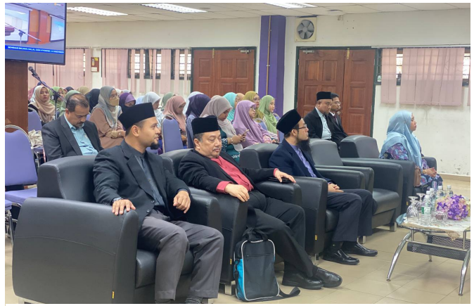
Suasana sekitar majlis perasmian seminar