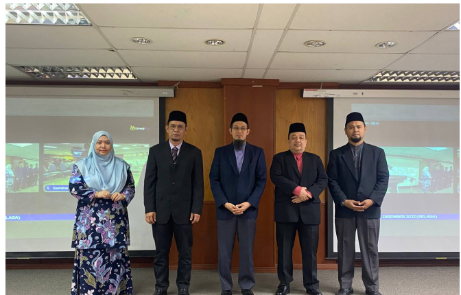
Gambar bersama pembentang