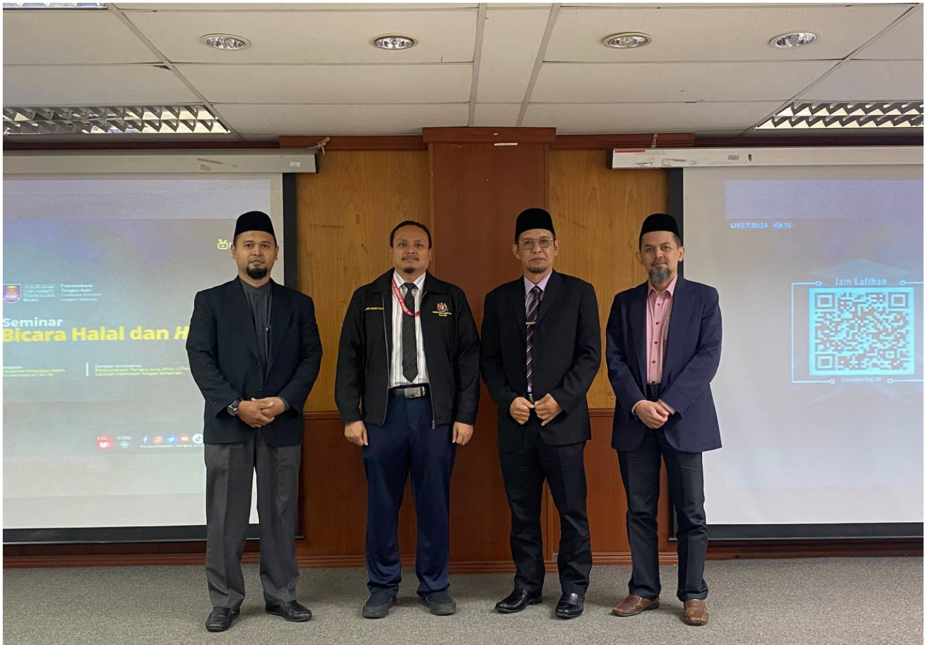
Gambar bersama pembentang

Disamping itu juga, pihak Hospital Kuala Krai juga mengambil kesempatan ini dengan mengadakan kempen derma darah yang bertempat di perkarangan Lobi HRD (A) Blok A. Kempen ini mendapat sambutan yang menggalakkan daripada pelajar serta staf UiTMCK dimana mereka telah menderma darah di kempen tersebut.