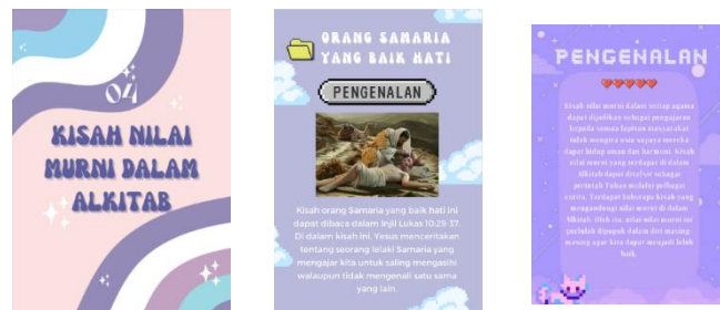
Rajah 5. Paparan tajuk keempat: Kisah Nilai Murni dalam Kitab

Dalam tajuk ini, pelajar diminta untuk mencari kisah nilai murni dalam kitab yang boleh menjadi teladan dalam menghadapi cabaran hidup beragama pada zaman kini.