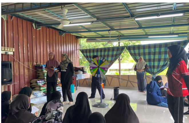
Aktiviti roda impian

PTA telah melakukan beberapa aktiviti ilmiah yang dikendalikan oleh pelajar latihan industri daripada Univeristas Airlangga (UNAIR) dan Universiti Teknologi MARA (UiTM). Aktiviti yang telah dijalankan adalah roda impian, cari benda tersembunyi, mewarna penanda buku dan read aloud . Kesemua aktiviti ini melibatkan anak-anak yatim RAYLD seramai 20 orang.