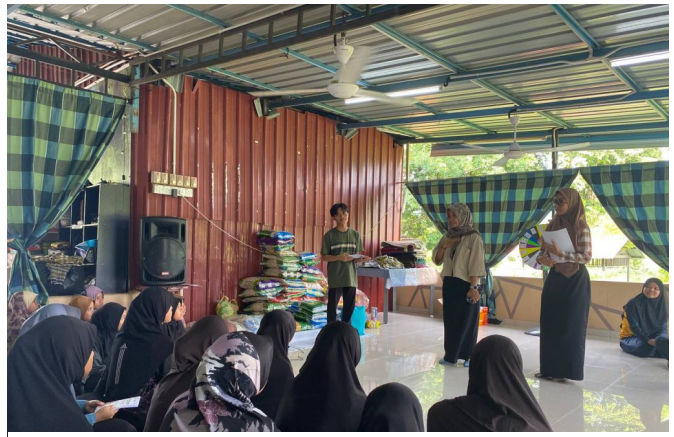
Aktiviti bersama pelajar latihan industri UNAIR