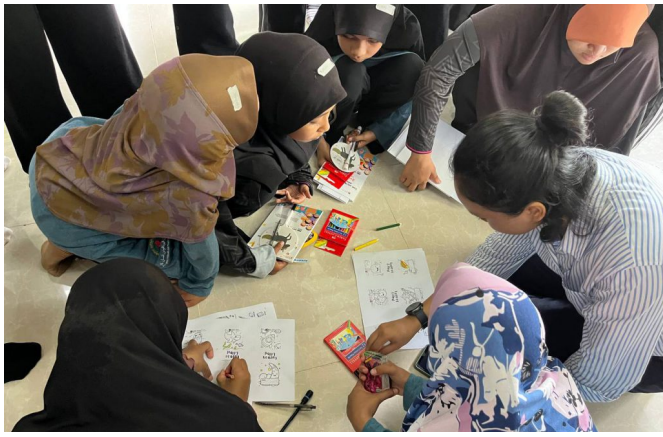
Aktiviti mewarna penanda buku