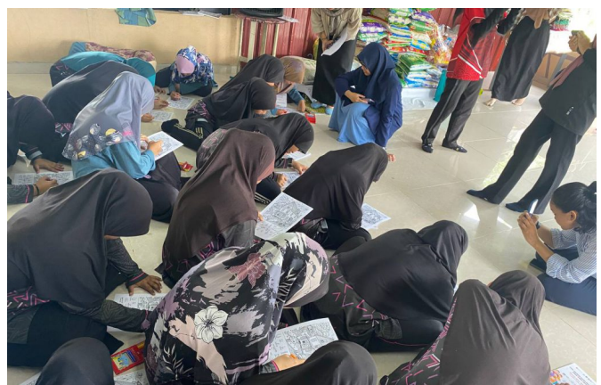
Aktiviti cari benda tersembunyi