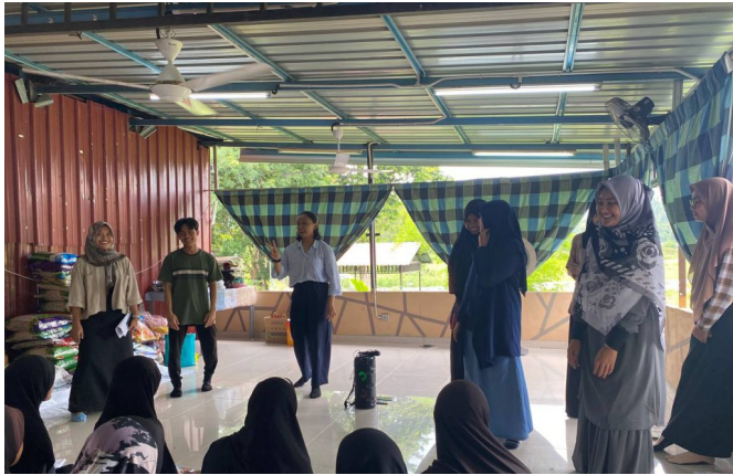
Aktiviti bersama pelajar latihan industri UNAIR