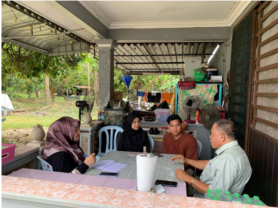
Rajah 1: Pertemuan pertama bersama pengkisah bagi sesi perkenalan