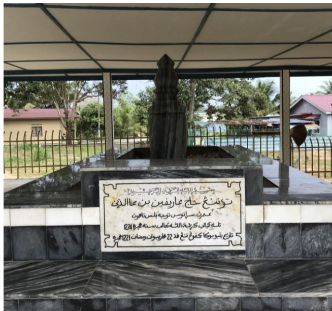
Rajah 4: Makam Tok Tenang, Labis, Johor