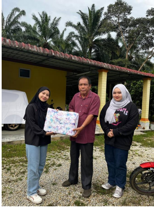
Rajah 3: Pertemuan kedua bersama pengkisah