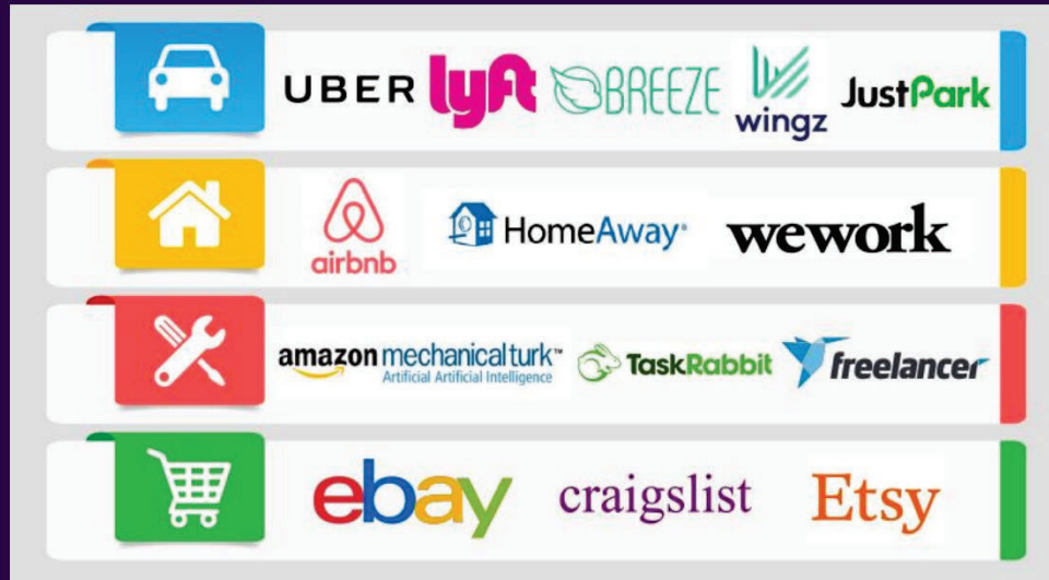
Contoh syarikat menjalankan ekonomi perkongsian