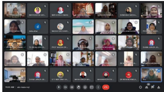
Rajah 1.1: Penilai yang menyertai Bengkel Penilaian Laporan ePSRR UiTM Cawangan Negeri Sembilan secara atas talian

Seramai 66 orang penilai terlibat dari ketiga-tiga kampus (Kampus Kuala Pilah, Kampus Seremban dan Kampus Rembau) di dalam proses penilaian ePSRR bagi 20 program yang ditawarkan di UiTM Cawangan Negeri Sembilan. Hasil penilaian yang telah dibuat akan dibentangkan kepada Timbalan Rektor Hal Ehwal Akademik UiTM Cawangan Negeri Sembilan pada pertengahan tahun 2023 bagi pengesahan hasil pelaporan tersebut.