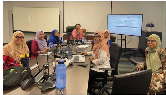
Rajah 1.3: Gambar sewaktu bengkel pemurnian laporan eSRR UiTM Cawangan Negeri Sembilan