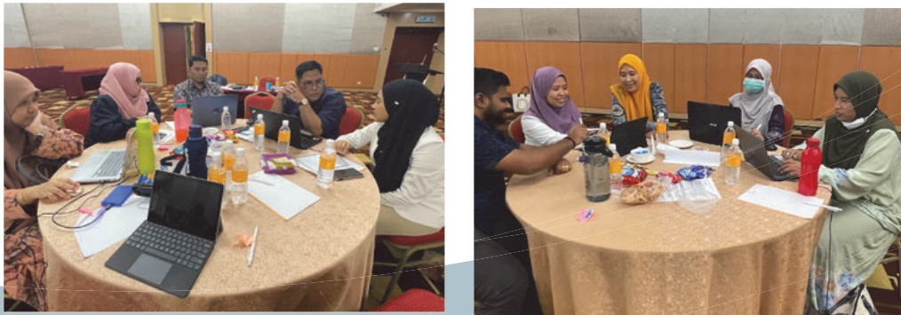
Sesi Perbincangan dalam Kumpulan