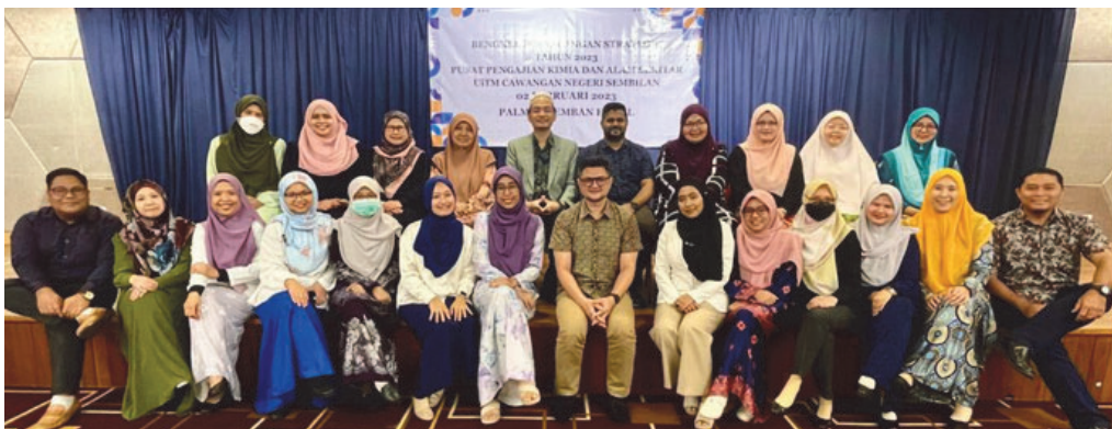
Rajah 3: Peserta Bengkel Perancangan Strategik PPKAS 2023