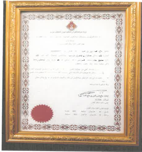
SIJIL PERLANTIKAN SEBAGAI IMAM