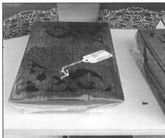
Gambar 4: Contoh Ukiran Kayu