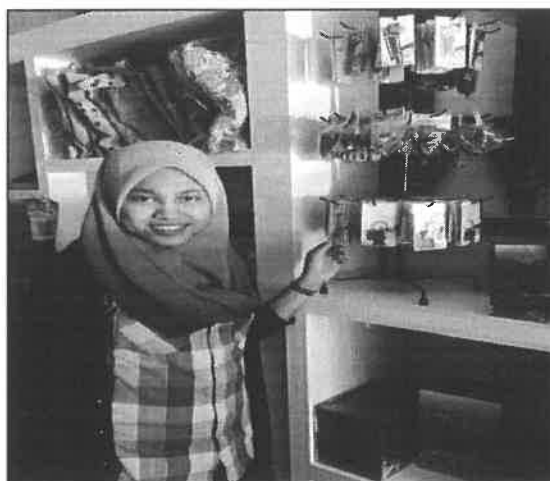
Gambar 2: Cenderahati