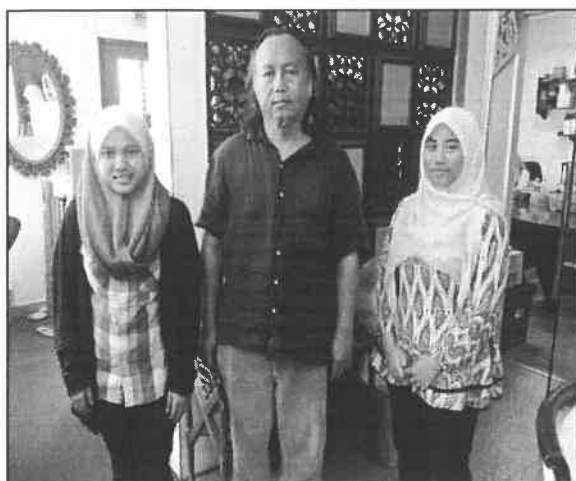
Gambar 1: Menembual Bersama Tokoh