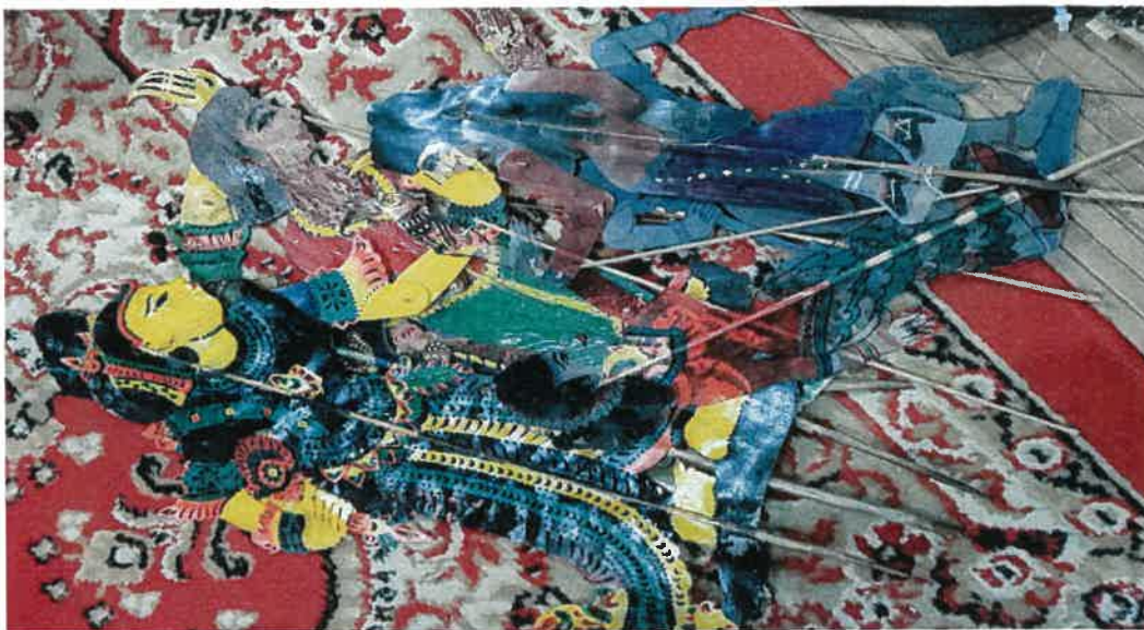
Gambar: Patung Wayang Kulit