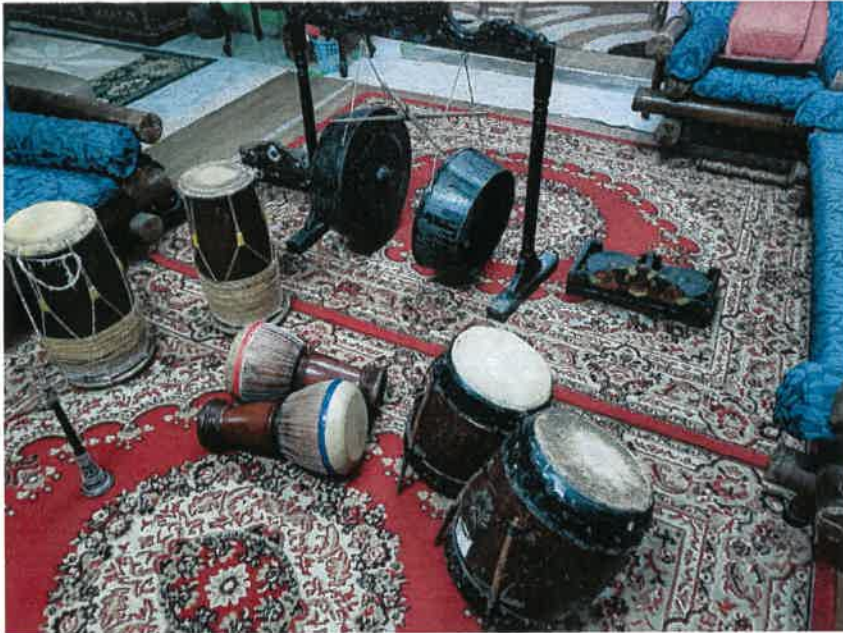
Gambar: Alat alat muzik yang digunakan ketika persembahan