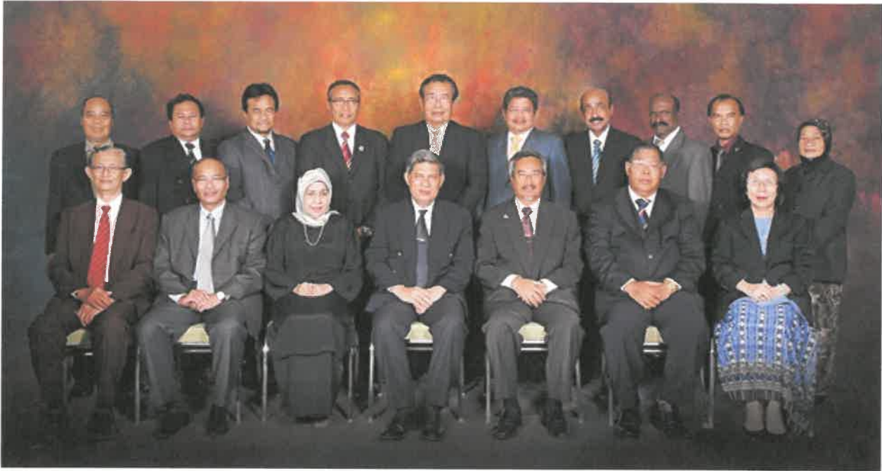
Gambar Barisan Kepimpinan Kementerian Pelajaran Malaysia