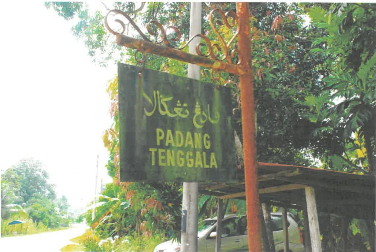
Papan Tanda Kampung Padang Tenggara