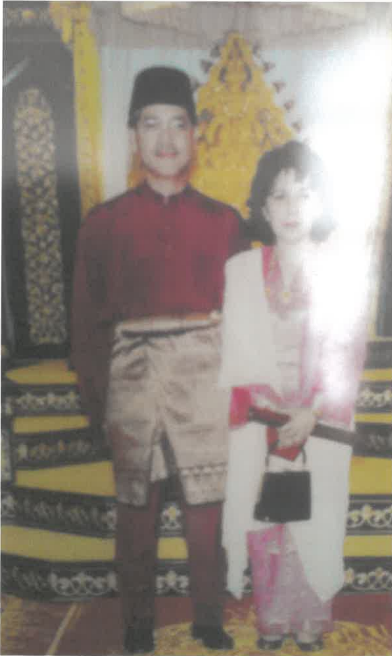
Bersama Arwah Suaminya