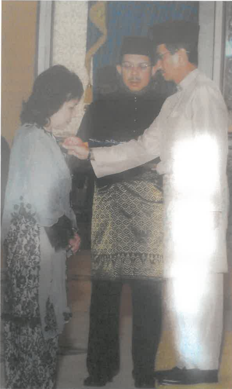
AHLI MANGKU NEGARA (A.M.N) 2007 (Seri Paduka Baginda Yang di-Pertuan Agong)