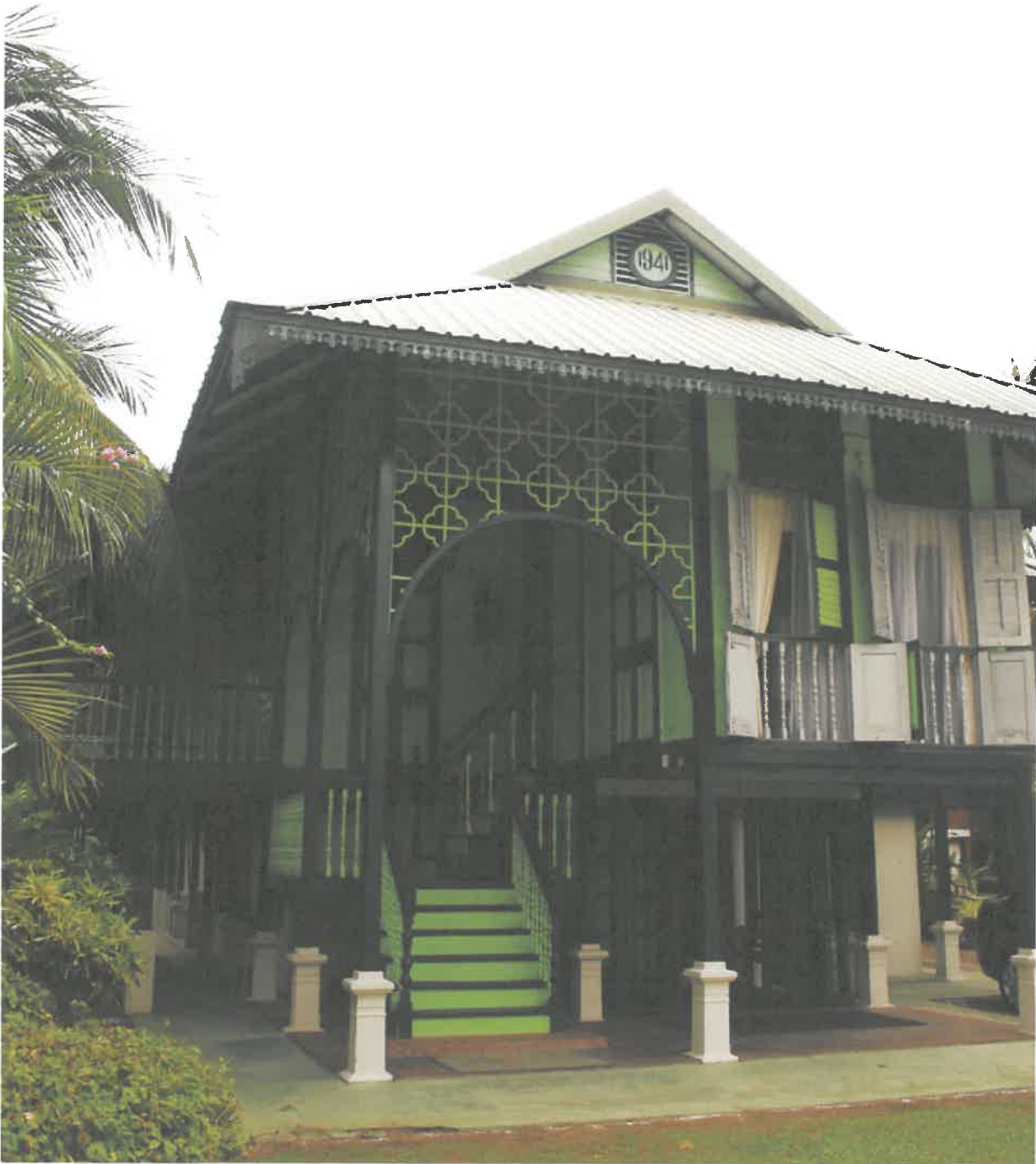
Rumah Hijau Kini