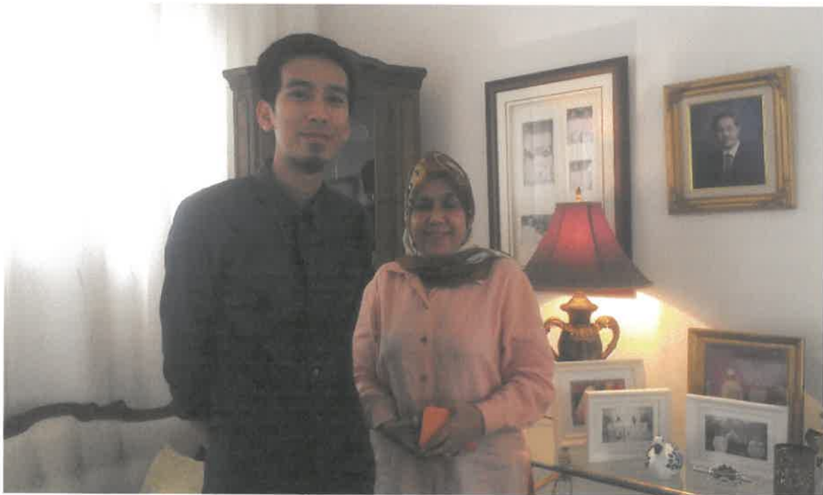
Gambar Semasa Interview