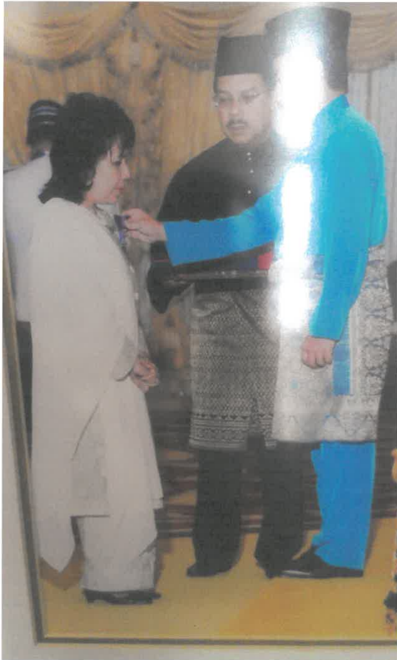
PINGAT JOHAN SETIA MAHKOTA (J.S.M) 2009 (Seri Paduka Baginda Yang di-Pertuan Agong)