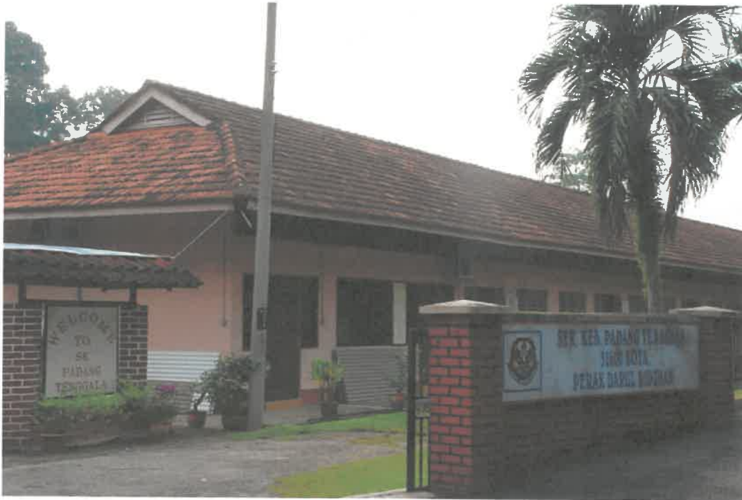
Sekolah Kebangsaan Cikgu Mior Shahrussin (Sekolah Kebangsaan Padang Tenggara)