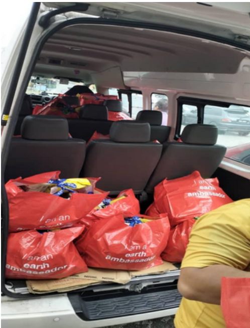
Barangan sumbangan yang telah disediakan untuk dihantar ke Semarak Resource Centre, Nilai.