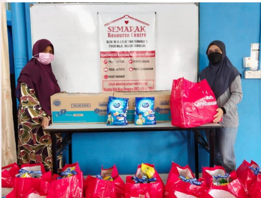
Penyerahan sumbangan kepada golongan B40

Diharapkan program seperti ini dapat dijalankan lagi di masa hadapan yang mana program ini dapat menjalin hubungan baik antara penyarah dan masyarakat setempat.