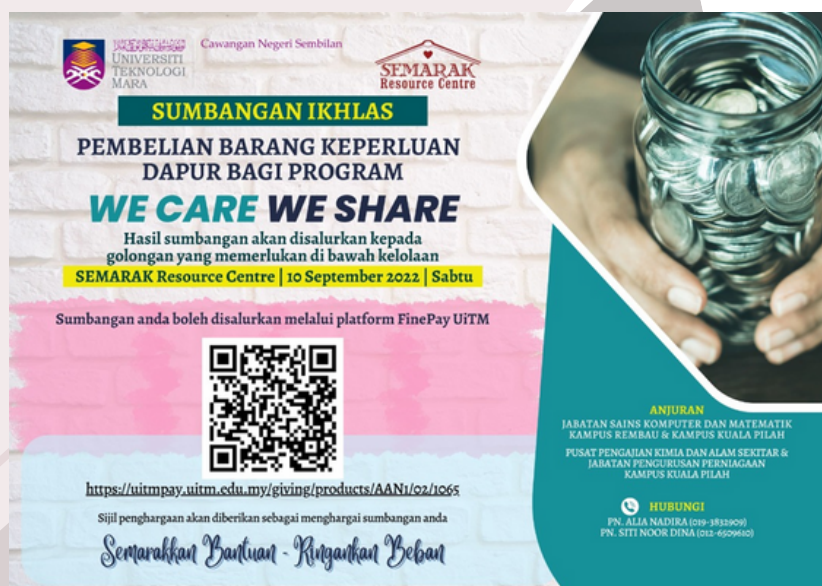
Poster hebahan kutipan dana Program We Care We Share

Program We Care We Share ini adalah program khidmat masyarakat yang dianjurkan bertujuan untuk mengumpul dana sumbangan. Pengumpulan dana ini adalah untuk membeli barangan keperluan dapur untuk diagihkan kepada seramai 40-50 orang golongan B40 yang memerlukan di bawah kelolaan non-governmental individuals (NGI) Semarak Resource Centre. Antara barangan keperluan dapur adalah seperti berikut: beras 5 kg, minyak masak 1 kg, teh uncang, gula, garam, susu pekat, kicap dan tepung.