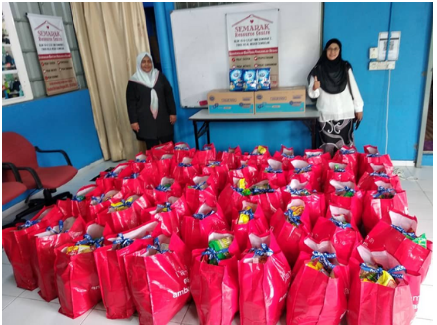
Penyerahan 45 buah beg sumbangan serta 27 paket susu Dutch Lady

Diharapkan program seperti ini dapat dijalankan lagi di masa hadapan yang mana program ini dapat menjalin hubungan baik antara penyarah dan masyarakat setempat.