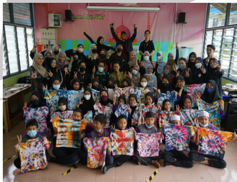
Sesi Bergambar Kenangan Bersama Peserta