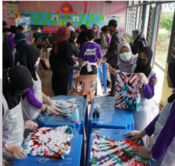
Aktiviti 1 – Tie Dye T-shirt

Program ini juga dapat melatih mahasiswa UiTM dalam meningkatkan kemahiran kepimpinan dan sosial dalam melaksanakan sesebuah program bersama komuniti, dapat menyuntik semangat berpasukan serta mengeratkan silaturrahim antara JPK dan PIBG SK Pilin. Program ini dimulakan dengan ucapan aluan penasihat program dan dirasmikan oleh Guru Penolong Kanan Kurikulum, SK Pilin.