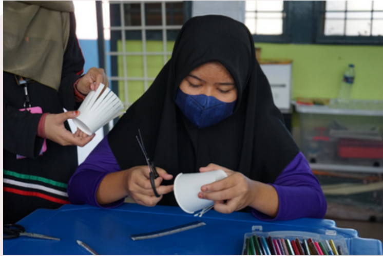
Aktiviti 2 – Burung Merak (Teknik Anyaman)

Program bersambung dengan aktiviti kedua iaitu penghasilan burung merak melalui teknik anyaman yang telah dipelajari dalam mata pelajaran Pendidikan Seni dan Visual.