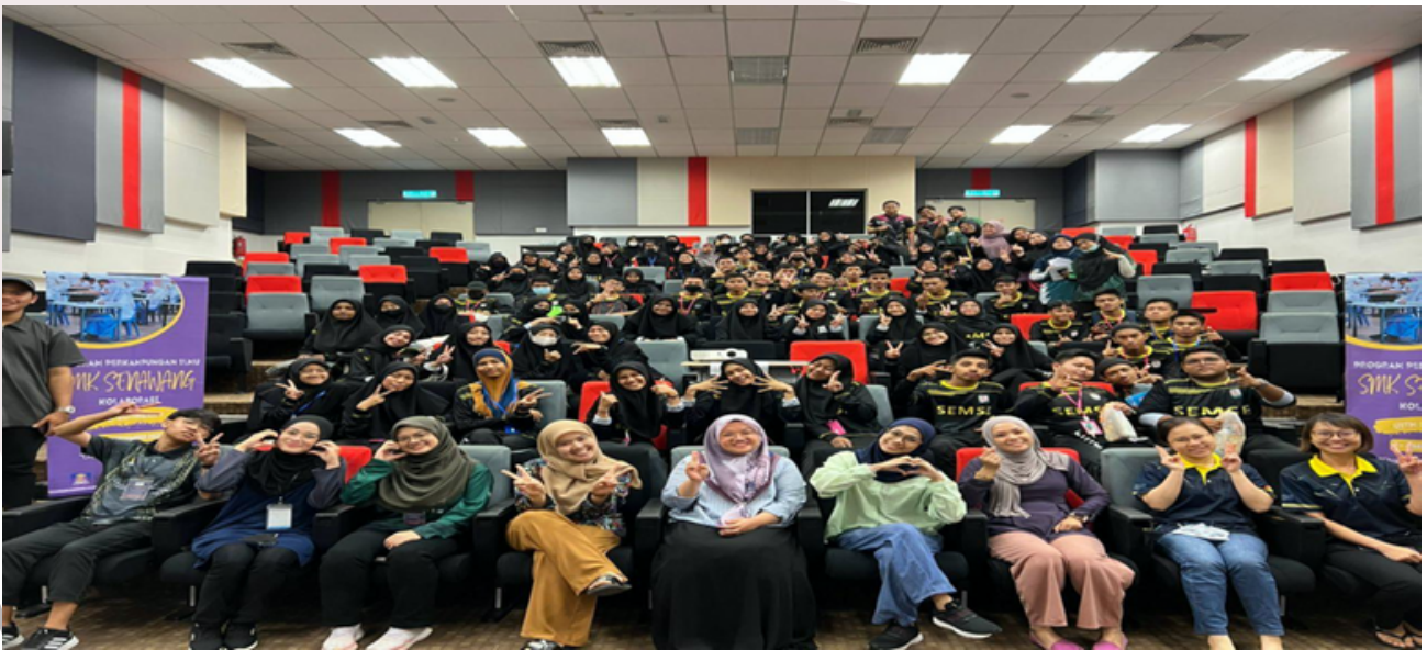
Aktiviti "Language Explorace" bersama para pensyarah APB Kampus Seremban

Para Fasilitator GMPS Kampus Seremban telah menjalankan tugas mereka dengan sangat baik dan mendapat pujian daripada pihak sekolah. Selain daripada merancang segala aturan perjalanan aktiviti bersama dengan pihak APB Kampus Seremban, mereka juga telah berjaya membantu pihak sekolah dari segi tenaga, teknikal dan juga sokongan kepada para peserta. Para fasilitator telah berjaya menganjurkan program ini dalam masa yang singkat dan program ini telah menjadi satu program kayu ukur kepada banyak lagi program bersemuka yang akan dianjurkan oleh pihak GPMS Kampus Seremban bersama-sama dengan pihak dalaman UiTM dan komuniti luar. Sebahagian besar peserta program telah memberikan respon yang sangat positif kepada penganjuran program ini. Mereka turut bersetuju bahawa program ini adalah satu usaha yang sangat baik dan memberi mereka motivasi bagi menghadapi peperiksaan SPM pada tahun hadapan. Diharapkan, program dan kerjasama jitu seperti ini akan dapat dilaksanakan lagi pada tahun-tahun yang akan datang dan pihak GMPS Kampus Seremban sentiasa berjaya melahirkan para pemimpin yang dinamik serta berbakat seterusnya berbakti kepada Universiti dan masyarakat selaras dengan moto Gagasan Pelajar Melayu Semenanjung iaitu "Belajar Terus Belajar".