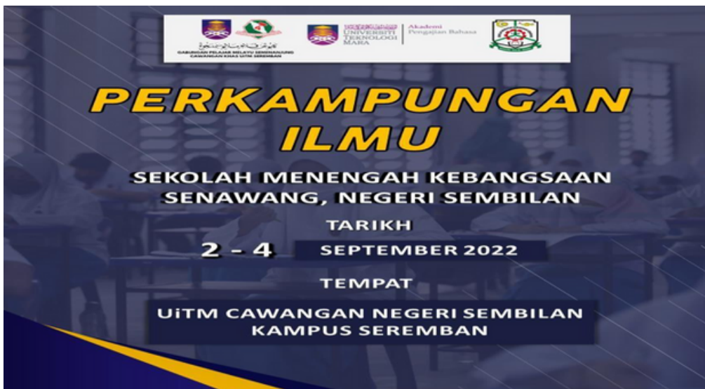
Poster Program “Perkampungan Ilmu Bersama SMK Senawang”

Tujuan program ini diadakan bertujuan memperkasakan usaha sama antara GPMS Kampus Seremban bersama APB Kampus Seremban melalui penglibatan pihak sekolah serta Persatuan Ibu Bapa dan Guru (PIBG) SMK Senawang. Selain itu, program ini juga diadakan untuk memberi peluang kepada calon-calon peperiksaan SPM yang terpilih dari SMK Senawang untuk merasai sendiri kemudahan dan fasiliti yang ada di UiTMCNS Kampus Seremban serta memberi mereka pendedahan awal berkenaan kehidupan sebenar di kampus. Pihak Sekolah juga menanam harapan agar dengan pendedahan awal tersebut dapat meningkatkan keinginan dan keazaman mereka untuk melanjutkan pelajaran ke peringkat lebih tinggi setelah mereka berjaya menamatkan peperiksaan SPM kelak. Terdapat satu kajian yang dikongsikan oleh seorang perunding latihan yang dikenali sebagai Nik Akmal dan beliau mendapati, data daripada Jabatan Perangkaan Malaysia (DOSM) mendedahkan bahawa lebih 72% rakyat Malaysia memilih untuk tidak menyambung pelajaran mereka selepas peperiksaan SPM (Hafiz Mutalib, 2022). Justeru itu, Program Perkampungan Ilmu ini dilihat sebagai suatu kerjasama yang utuh dan efektif di antara pihak SMK Senawang, GPMS Kampus Seremban dan juga APB Kampus Seremban.