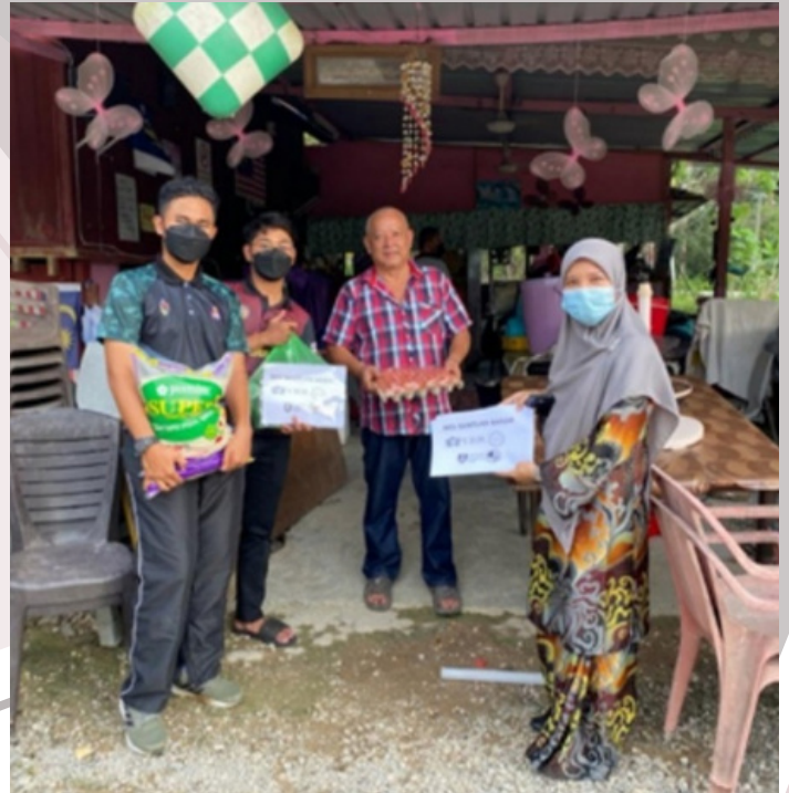
Gambar kenangan misi bantuan banjir bersama penduduk.

Akibat daripada impak perubahan iklim dan cuaca yang ekstrem pada bulan Disember 2021, sebahagian besar negeri - negeri di Malaysia mengalami bencana banjir pada pertengahan bulan Disember 2021.