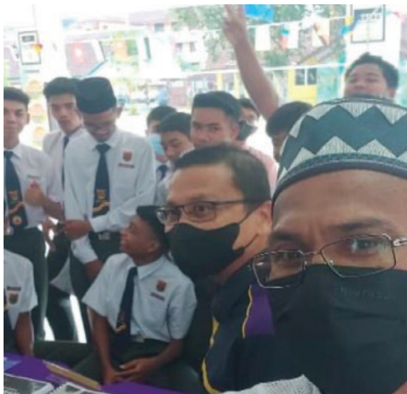
Gambar 2: Petugas pameran sedang melayani pengunjung

Objektif utama UiTM Kampus Rembau menyertai pameran kerjaya ini ialah untuk mempromosi serta memberi pendedahan awal kepada pelajar-pelajar sekolah rendah dan menengah di sekitar Daerah Rembau tentang kursus-kursus di peringkat pra diploma, diploma, ijazah sarjana muda, sarjana dan doktor falsafah yang sedang ditawarkan di UiTM Kampus Rembau secara khususnya dan di UiTM seluruh Malaysia secara amnya. Selain itu, pameran ini juga bertujuan untuk memberi pendedahan mengenai peluang-peluang pekerjaan yang boleh mereka ceburi selepas menamatkan pengajian di UiTM. Oleh itu, para petugas pameran telah menerangkan secara terperinci kepada para pelajar tentang nama-nama kursus pengajian yang ditawarkan, syarat-syarat kelayakan untuk memohon mengikuti sesuatu kursus pengajian dan peluang kerjaya selepas menamatkan pengajian. Di samping itu juga, pameran ini diadakan bertujuan untuk memberi motivasi kepada para pelajar dalam mempelajari kursus-kursus berkaitan bidang STEM di UiTM dan seterusnya menceburi bidang kerjaya berkaitan STEM.