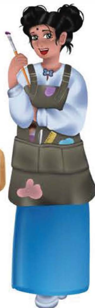
Nita Nita Munira An Suresh